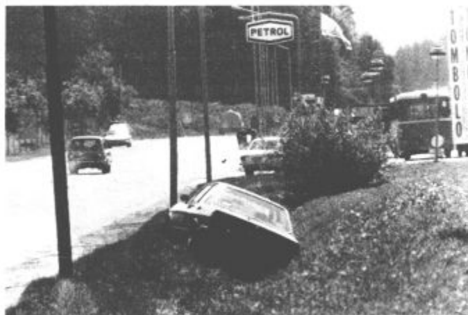
Prehltra(?) voznja in končaš v jarku (vos)

V nedeljo je neznan storilec vlomil v osebni avtomobil Diana parkiran pred restavracijo Jezero. Ukradel je naslonjali za glavo ter vzvratno ogledalo in prerezal platneno streho.