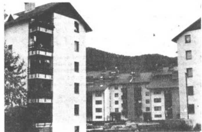
Ob razvoju industrije se tudi Nazarje nenehno širijo

Le 8 desetini je merilo svojo spretnost pri veteranih. Salečani se kljub svojem letom niso dali in so z 922 točkami zmagali pred člani IGD šoštanjske tovarne usnja, 921, in ekipo Titovega Velenja s 903,5 točke.