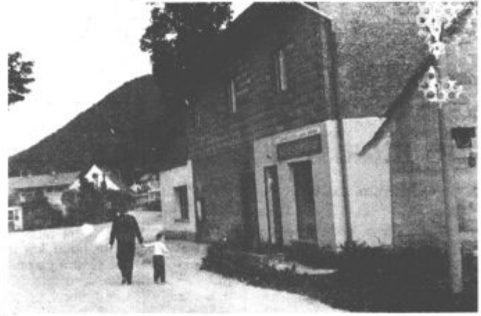
Prostore za slaščičarno imajo, žal pa imajo tudi neizpolnjene obljube GTP Turist in nič slaščic seveda