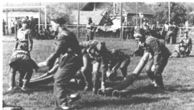
Sklopiljanje cevi jim je šlo dobro od rok