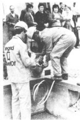
V petek, 30. maja, so položili temeljni kamen za gradnjo prizidka