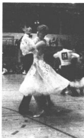
Tekmovanje se bo začelo ob 19. uri.

Za ljubitelje plesa bo v soboto zvečer v Rdeči dvorani zelo zanimiva prireditev. Plesnemu klubu Velenje je Zveza plesnih organizacij zaupala izvedbo državnega prvenstva v kombinaciji vseh 10 standardnih in latinsko-ameriških plesov za pionirje, mladince ter člane. Poleg najboljših jugoslovanskih plesnih parov se bo gledalcem predstavilo in pokazalo, kako že obvladajo plesni korak, tudi približno 100 velenjskih otrok, ki obiskujejo plesno šolo v klubu.