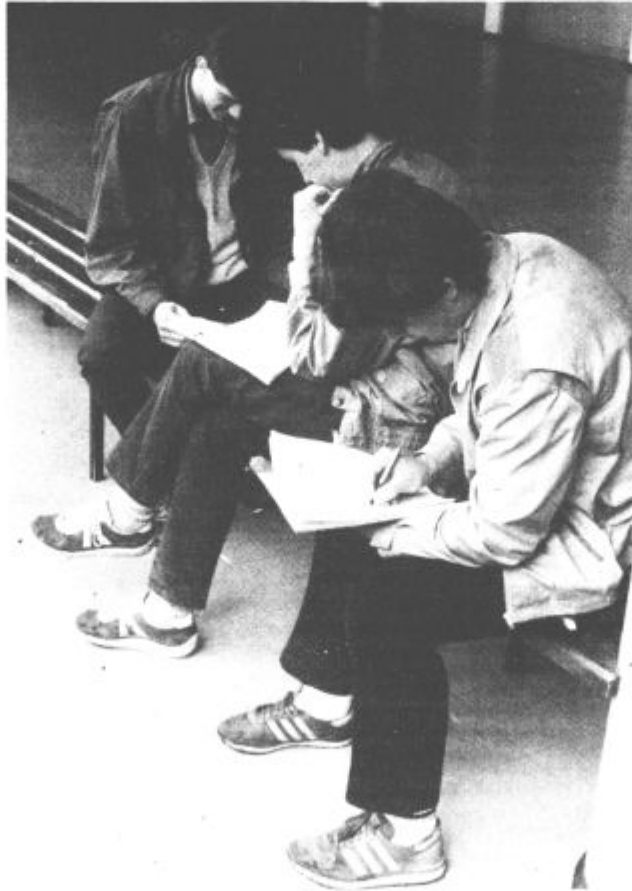
... in konec bo vseh skrbi. Šolska vrata bodo zaprli, hrami učenosti utihnili. Do takrat pa še kopica kontrolnih nalog, zato je potrebno vsak trenutek izkoristiti za obnavljanje znanja. Toda ob koncu junija bo tudi te »vročine« konec.