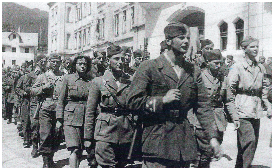
Prihod partizanov v Idrijo maja leta 1945

Domobranci so še bolj zagrenili naše življenje. V prvi večji Palacini so do