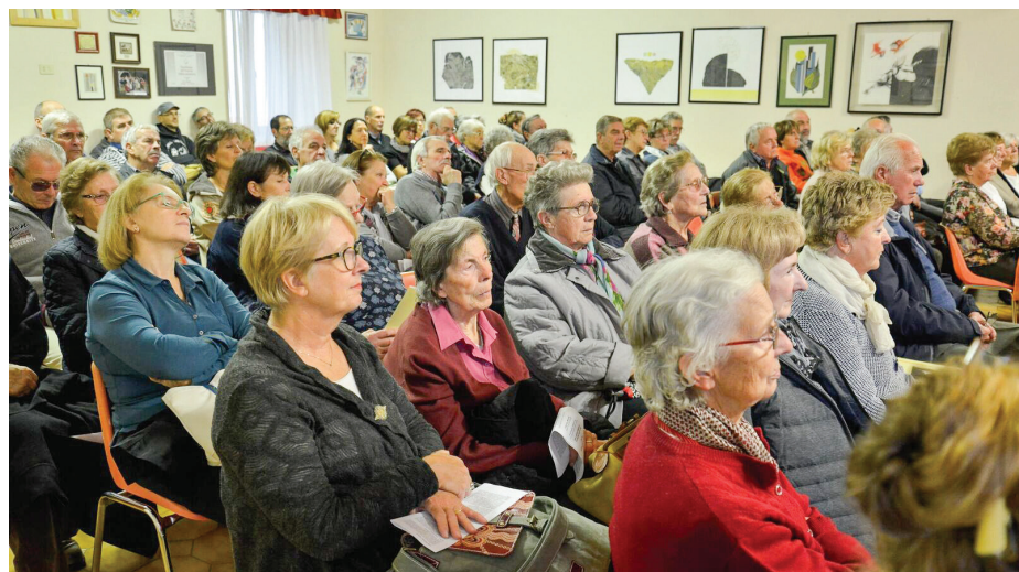
Polna dvorana obiskovalcev je prisluhnila partizanski pesmi.

Poseben večer smo posvetili partizanski pesmi, saj je prav pesem bodrila in spodbujala borce v najhujših trenutkih. Koncert smo priredili v dvorani vaškega kulturnega doma v nedeljo, 23.