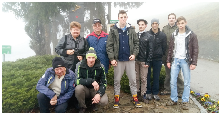
Pohod Mladih borcev na Svetino