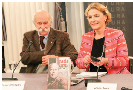
Vesna Pusić in Janez Stanovnik na predstavitvi knjige v Zagrebu