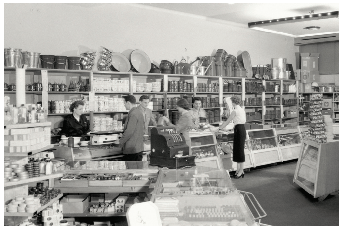
Trgovina Nama, Ljubljana, junij 1956

razstavo je uporabljeno muzejsko, arhivsko, knjižnično in filmsko gradivo iz različnih ustanov iz vse regije, med drugim tudi gradivo Muzeja novejše zgodovine Slovenije.