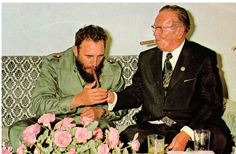
Fidela Castra in Josipa Broza Tita je družila tudi ljubezen do cigar.

Takoj po prihodu na oblast se je Castro zapletel v spor z ZDA, vodilno državo zahodnega bloka, ki je podpirala Batis-to. Castro je s svojimi komunističnimi nazori nacionaliziral rafinerije nafte, tovarne sladkorja in elektrarne. Spor se je tako poglobljajal, da so leta 1960 Združene države Amerike prenehale kupovati kubanski sladkor in uvedle gospodarski embargo proti Kubi, ki v večini velja še danes, čeprav so ga pred kratkim nekoliko omilile. Leto dni zatem so ZDA sku-