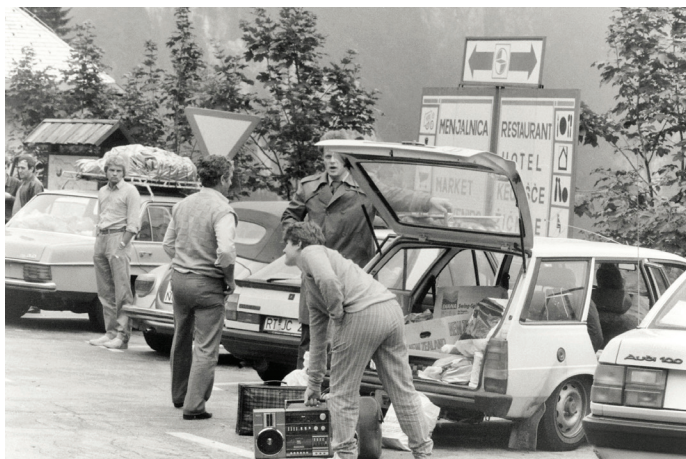
Vrež na mejnem prehodu Ljubelj, julij 1989

Vsebinsko gostujoče razstave so obogatili s predmeti iz zbirk Muzeja novejše zgodovine Slovenije in sorodnih ustanov, pridobili so jih z zbiralno akcijo, ki je potekala od maja letos. Iskali so izdelke slovenskega izvora pa tudi take, ki sicer niso bili plod domačega znanja, so pa nedvomno zaznamovali vsakdanjik v socialistični Sloveniji. Tako bodo obiskovalci na razstavi lahko videli tudi Marlesovo kuhinjo tipa Cocktail variant iz 70. let prejšnjega stoletja, elemente dnevne sobe in rekonstrukcijo delovnega koticčka tajnice. Nekateri obiskovalci se bodo tako spomnili, drugi pa bodo prvič videli, v kakšnih razmerah se je nekoč živelo, kakšne so bile osnovnošolske torbe, Mehanoteknikine igrače, s katerimi so se igrali ot-