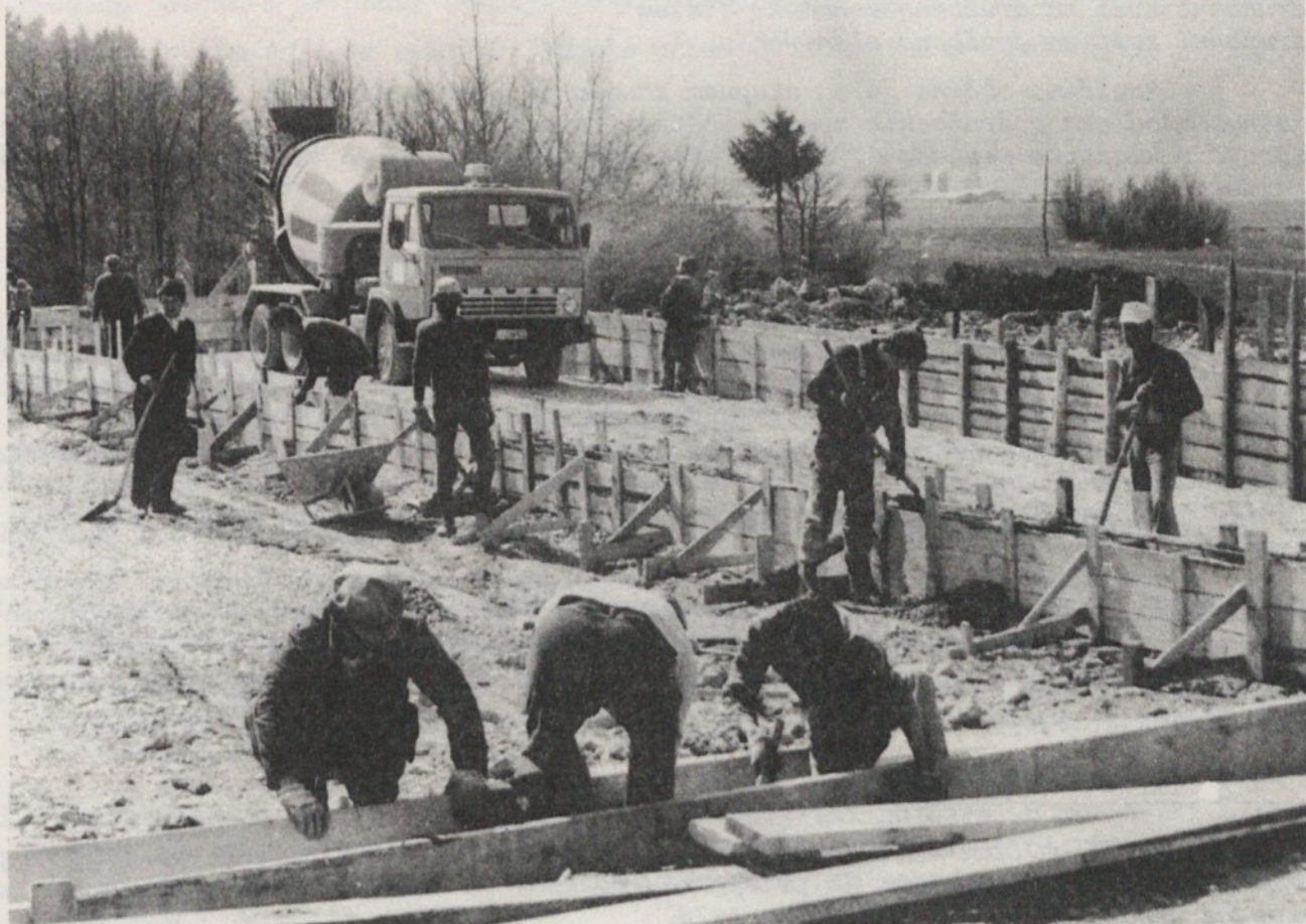
Začetek gradnje šole v Dobropolju

ZA 27. APRIL DAN USTANOVITVE OF IN 1. MAJ - PRAZNIK DELA