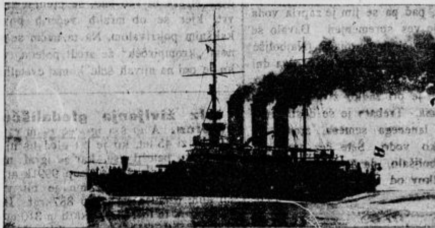
Avstrijska bojna ladja „Sv. Jurij“.

Žrebeta so od narave že jako rahločutna, da se ne dajo z lepo prijemati za noge, jih privzdigovati in po njih telči. To jih navadno silno ščegeta in plaši. Vendar se sčasom morajo tega privaditi. Da se to polagoma zgodi, gladimo z roko žrebe večkrat po nogah, nato jih rahlo privzdiguje, od