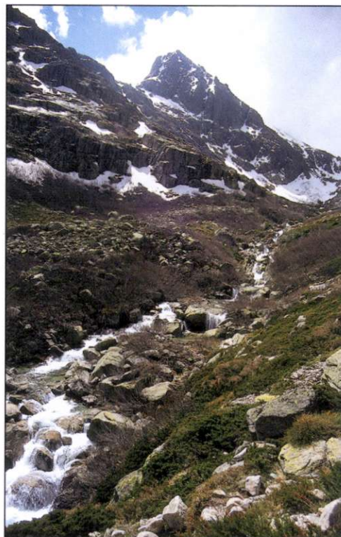
Slika 3: Dolina reke Restonice s slapovi in jezeri ledeniškega nastanka.

lepote. Korzičani so se vsem osvajalcem upirali z voljo, ki je bila trdna in močna kot granitna skala, iz katere je otok zgrajen.