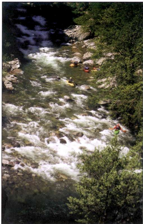
Slika 2: Kajakaši na reki Asco – kajakaška sezona traja od zgodnjega aprila do srede maja.