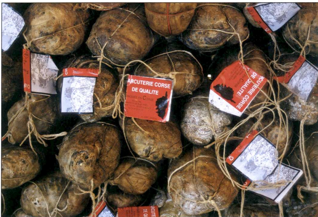
Slika 5: Korzika je znana po suhomesnatih izdelkih, ki jih tudi turisti radi poskusijo.

Za ogled zanimivo je mesto Corte v sredini otoka, ki predstavlja simbol korziške neodvisnosti,