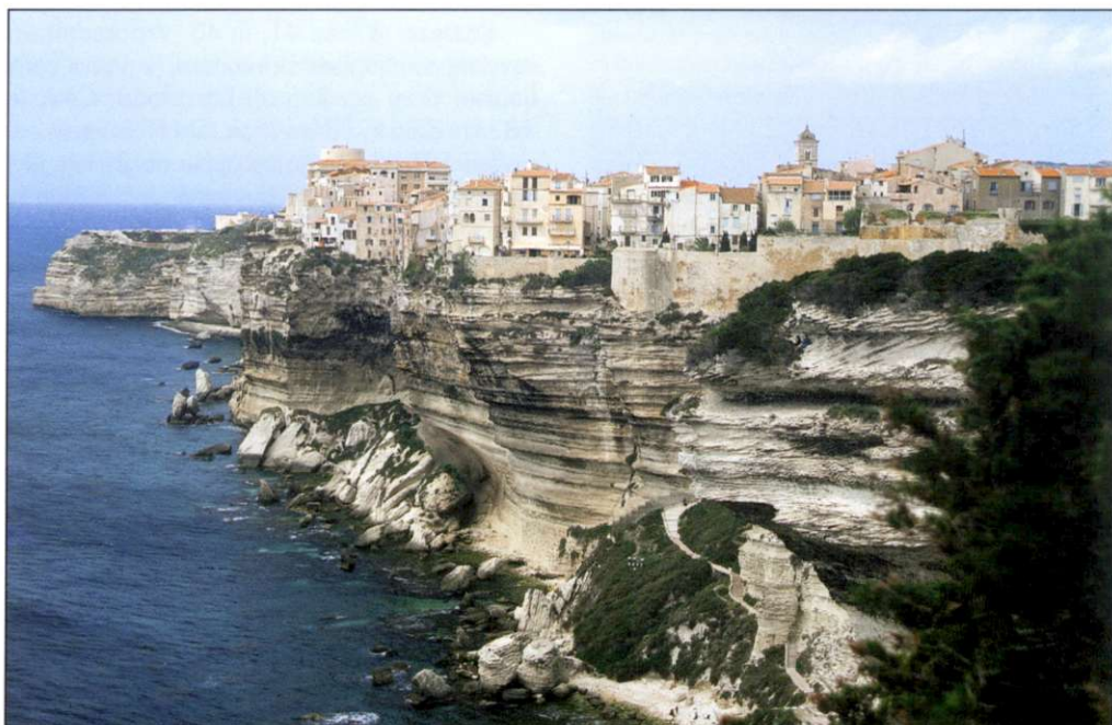
Slika 1 Bonifacio – utrjeno mesto na skrajnem jugu otoka, zgrajeno na skali.

Zgodovina. Zgodovina Korzike je zaradi številnih osvajalcev zelo pestra in polna dramatičnih dogodkov. V sli po bogastvu in oblasti so jo poskušali osvojiti Iberci, prebivalci Ligurije, Feničani, Etruščani, Kartażani, Rimljani, Vandali, prebivalci srednjeveških mestnih držav Pise in Genove, Angleži, Italijani in Francozi. Tujci so jo želeli zavojevati predvsem zaradi njene pomembne strateške lege in legendarne