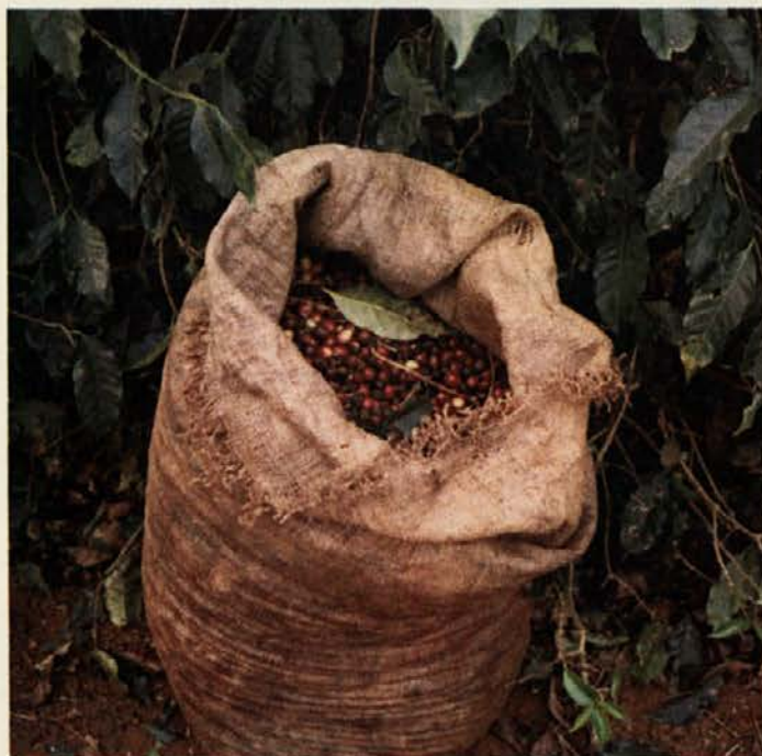
Sveže nabrani plodovi kavovca

Živimo v času in prostoru, v katerem so predmeti in dogodki postavljeni po vnaprej zastavljenem redu. Med vsem, kar nas obdaja, se pogosto nahaja tudi skodelica kave. Na videz skromna in majhna, v resnici močna in opazna. Opozarja nase tudi z vonjem, ki ga oddaja: ta je prijeten in dopadljiv in zanjo specifičen. Kava, ki je v skodelici, veliko pomeni le tistemu, ki jo bo spil; še pred tem pa je bila velikokrat pomembna še drugim.