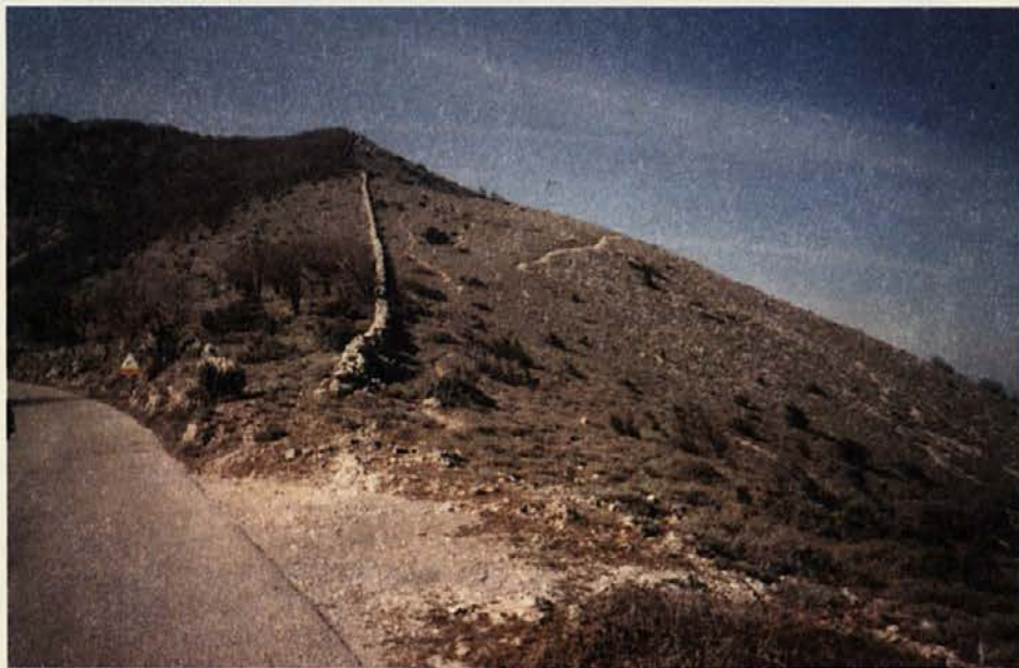
Človek je naredil zid iz kamna, ki se mu je valjal pod nogami, kar tako, kamen na kamen, in ta zid kljubuje soncu, dežju, burji - stoletja že, oj človek, arhitekt, umetnik ...

Veliko vas je, ki bi izstrelili kot iz topa - na Lošinj, seveda! Drugi zopet prisegate na večno lepoto bistre planinske hčere Soče in krnskega pogorja. Tretji se ogrevate, da bi končno vendarle naredili nekaj čisto konkretnega zase in se napotili v toplice, v Dobrno. Ostaja še prelepa istrska pokrajina, Mareda pri Novigradu. Pozabila nisem niti na tiste, sicer maloštevilne, ljubitelje počitnikovanja v prikolicah, v Gozdu Martuljku na primer ... Te možnosti ni več in treba se bo odločiti za kakšno drugo varianto. Pomembno je le, da celega dopusta ne preživite med domačimi stenami. Treba je oditi kamorkoli, pa čeprav le za nekaj dni.