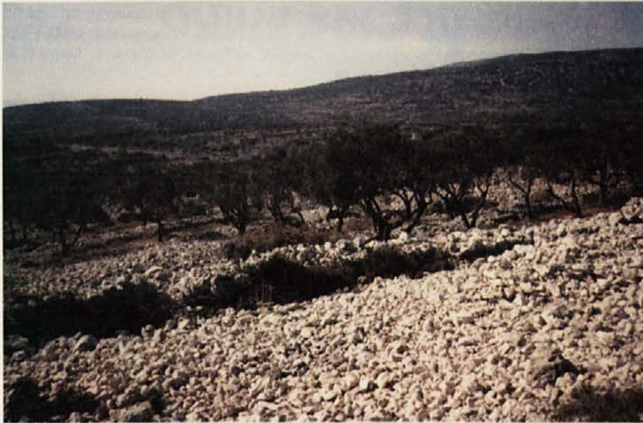
Oljčni nasadi. Zadnje desetletje vedno bolj spoštovano živilo, olivno olje, tu na Cresu raste kar iz kamenja.