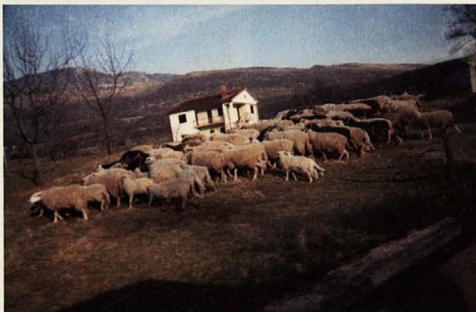
Pozno popoldne, družina se odloča, ali domov ali še malo popasti; na otoku Cresu pogosto srečamo ovčje črede

Če vašemu terminu ni možno ugoditi, se poskusite prilagoditi drugemu terminu ali pa se preusmerite na dopust kam drugam. Pravila pač morajo biti in vedno nam ne uspe vsem ugoditi. Skratka: ne dajte se!, in imejte se lepo, kjerkoli že boste.