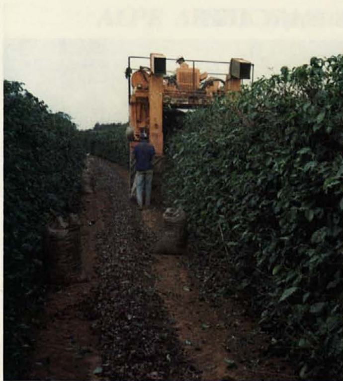
Strojno obiranje kavnih dreves

V Drogi d.d., Portorož se s praženjem kave ukvarjamo na zelo visoki strokovni ravni. Droga večino surove kave kupuje neposredno od proizvajalcev. Na primer: kava Minas, ki jo po zahtevah Droge pripravljajo v Braziliji, ima na vrečah dodatno deklaracijo. Iz le-te je razvidno, da je kava pripravljena za Drogo iz Portoroža. Za kakovost kavnih surovin imamo v Drogi postavljene zelo visoke normative. Naše kavne mešanice so sestavljene pretežno ali le iz kav Arabik.