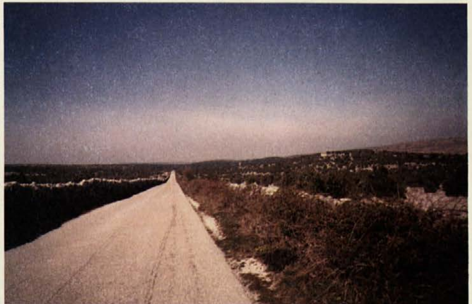
Le kam vodi tale slikovita, ravna pot? V Lopare ali iz njih? Prenekateri to že dobro veste ...