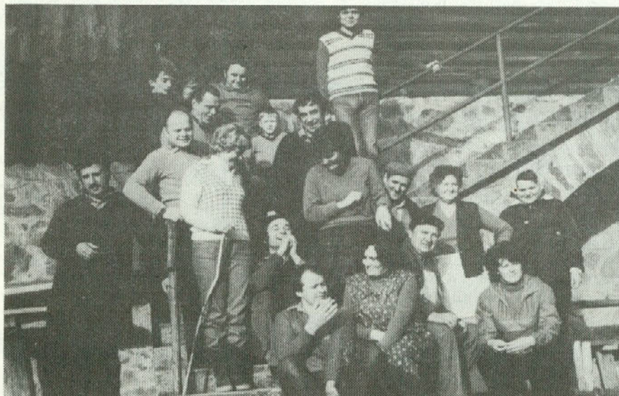
Planinci na občnem zboru 28. 1. 1983 na Gozdniku