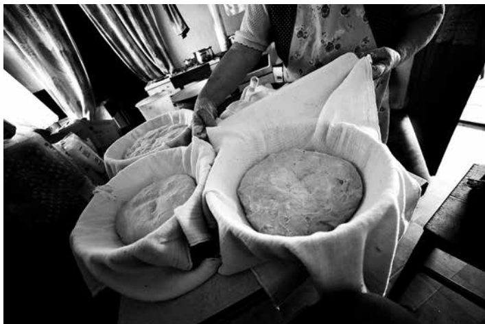
Naslov dela: PEČENI HLEBCI KRUHA