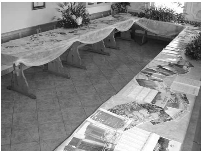
Utrinek z razstave o Občanu v prostorih Turističnega doma Destrnik

Z leti izhajanja časopisa Občan se je spreminjala tudi vsebinska sestava časopisa. Nekaj aktivnosti na tem področju je bilo