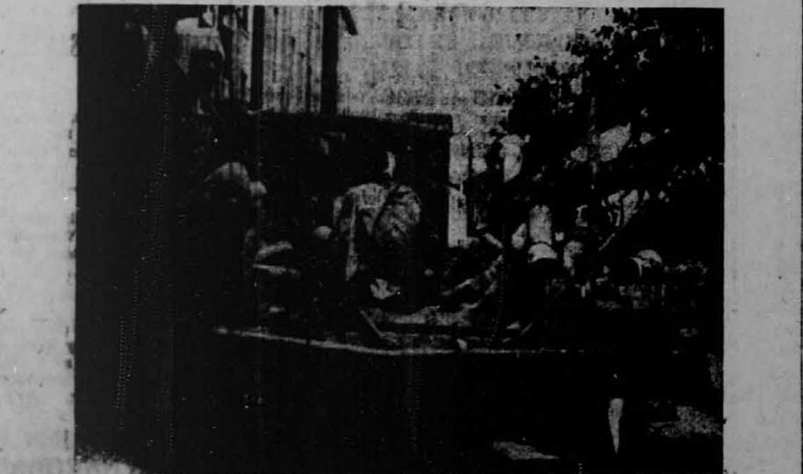
Ranjene kitajske vojske vozijo s fronte na truhlih v Šanghaj, kjer jih oddajo v vojaško bolnico, ki se nahaja v francoski naselbini.