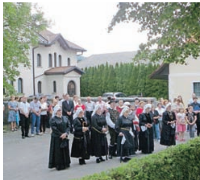
Slovesnost so polepsale gorenjske in meščanske narodne noše ter domači gasilci.