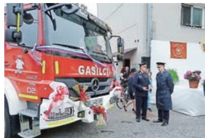
Nova gasilska cisterna bo motniškim gasilcem omogočila še učinkovitejšo delo.

»Z gasilskimi vozili smo opravili že veliko intervencij, zaradi česar postaja naš voznik park vedno bolj iztrošen, ne prizanaša pa mu niti zob časa. Kljub različnim omejitvam motniški gasilci vsekoli stremimo k temu, da nudimo občanom kar se da