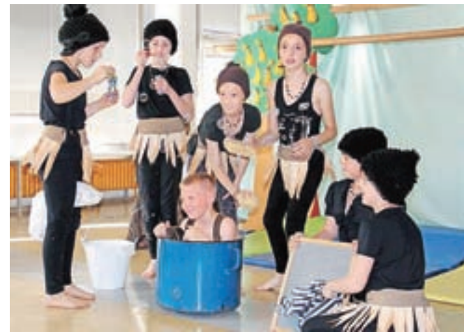
Mladi umetniki Osnovne šole Frana Albrehta v predstavi Juri Muri v Afriki / FOTO: JANEZ BERGANT