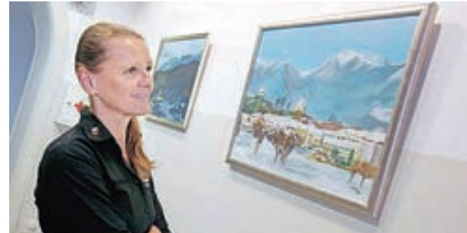
Dela Irene Redja so na ogled v času uradnih ur Občine Kamnik.

Razstava kamniške slikarke je v prostorih Občine Kamnik na ogled še vse do 5. avgusta.