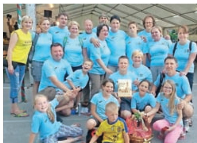
Vseslovenskega srečanja Selanov so se udeležili tudi krajani Sel pri Kamniku.

Sela pri Kamniku – V okviru društva ŠKD Sela smo se ga udeležili tudi Selani s Sel pri Kamniku in okoliških vasi. Srečanje je bilo sedaj že 20. po vrsti. Udeležilo se ga je kar trideset vasi iz cele Slovenije, skupaj je prišlo na dogodek okoli 700 ljudi. Z organiziranim prevozom v organizaciji ŠKD Sela se nas je na srečanje odpravilo 22. Tam smo se predstavili na uvodnem delu, povedali, od kod prihajamo in opisali svoj kraj in občino, iz katere prihajamo. Predstavili smo