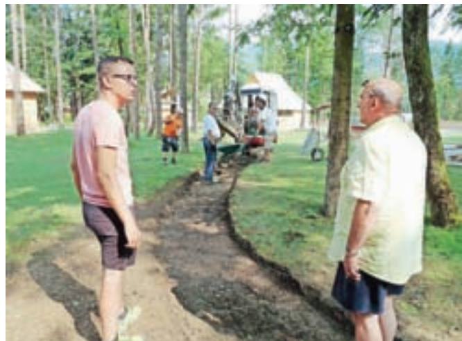
Te dni delavci v kampu intenzivno urejajo okolico.