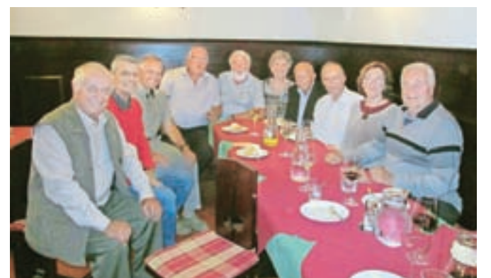
Druženje je bilo namenjeno predvsem izmenjavi spominov na nekdanje dni, ko so se vsak po svojih močeh in možnostih trudili v dobrobit občine Kamnik.