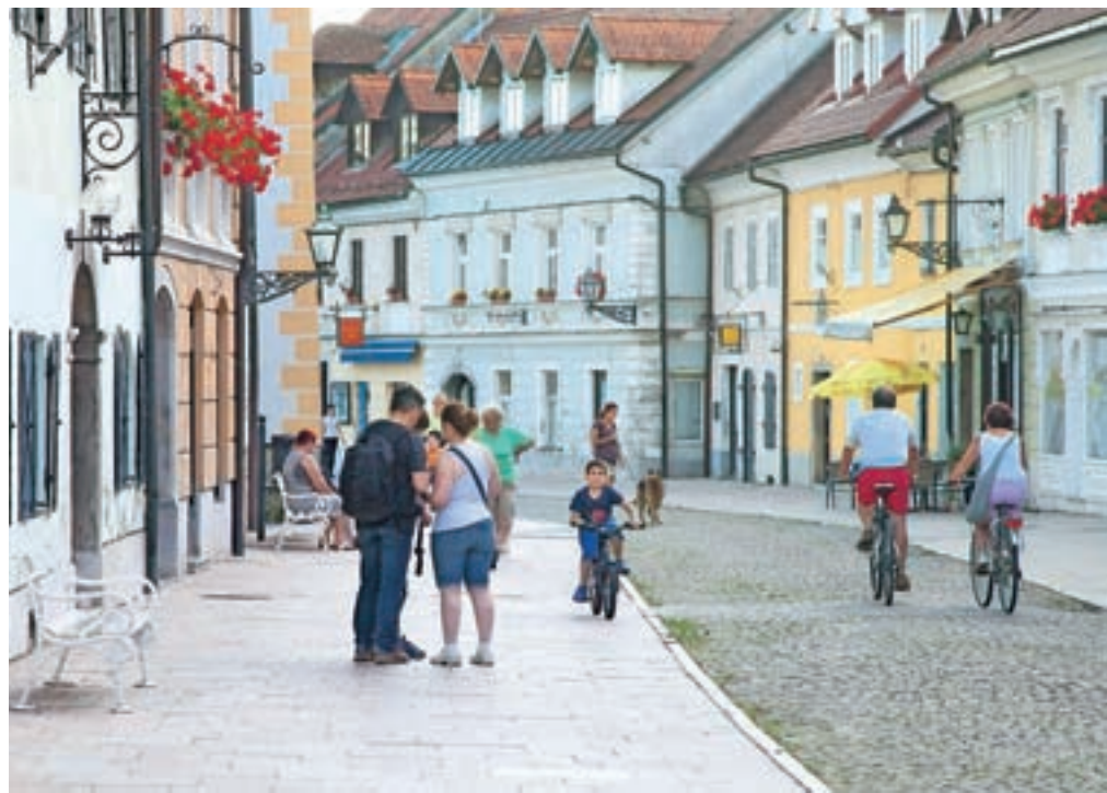
Ena od kamniških znamenitosti, ki navdušuje tuje turiste, je tudi Šutna.

Z obiski turistov in zasedenostjo kapacitet so kamniški turistični delavci za zdaj zadovoljni. »Glavna sezona se za nas šele dobro začinja, saj izkušnje minulih let kažejo, da največjo zasedenost lahko pričakujemo avgusta. Vsaj lanskega avgusta smo imeli polno, dobro kaže tudi letos. Vse pa se seveda odvisno od vremena. Naši gostje so v glavnem prehodni in se pri nas zadržijo dva do tri dni, prihajajo pa iz vse Evrope, tudi Slovenije. Letos je sploh veliko Poljakov in Čehov. Zanimivo je, da Kamnik številni vzamejo kot predmestje