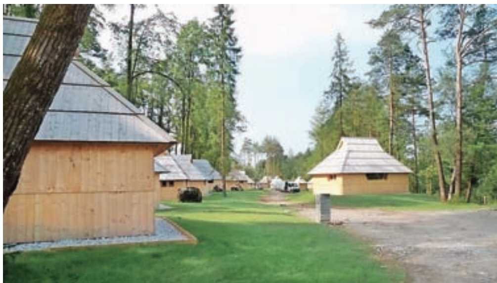
Devetnajst tipskih hišk je že postavljeno, a potrebnih dovoljenj še nimajo.

Kot smo preverili na Upravni enoti Kamnik, je investitor pri njih zaprosil za dve gradbeni dovoljenji. Septembra lani za postavitev 24 gostinskih objektov za kratkotrajno bivanje, mesec dni kasneje pa še za nezahtevni objekt. Gradbeno dovoljenje za slednjega, torej nezahtevni leseni in pritlični objekt tlorisnih dimenzij 4 x 6 metrov, namenjen za funkcionalne