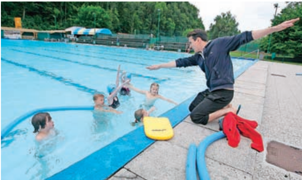
Brez bazena – tudi v hladnejšem vremenu – med poletnimi počitnicami preprosto ne gre.

bojke na mivki na igriščih Pod Skalco, zaradi velikega zanimanja pa so otroci igrali tudi na igrišču v Stranjah. Na kamniškem bazenu tudi letos vlada veliko zanimanje za plavalne programe Plavalnega kluba Kamnik, zato so ponovno razpisani trije 10-dnevni termini že zapolnjeni. Plavalni vrtec je namenjen najmlajšim, plavalni tečaj pa otrokom do 14. leta, pod budnim nadzorom plavalnih učiteljev pa otroci dobera spoznajo plavalne tehnike. Triatlon klub Trisport Kamnik že četrtič organizira Poletno šolo triatlona, kjer otroci spoznavajo triatlon, poleg tega pa še lahko jahajo konje, streljajo z lokom in plezajo. Različne športne aktivnosti pa trenirajo otroci