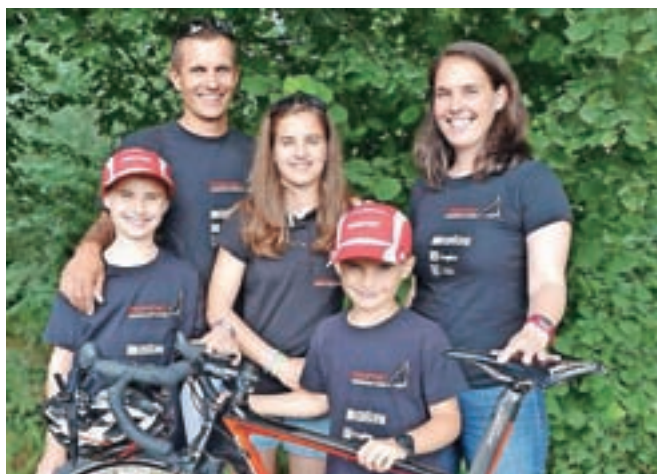
Športna družina Šporn

Ste športna družina. S katerimi športi se ukvarjate? Aleš in Teja: »Otroci se s športom ukvarjajo že, odkar