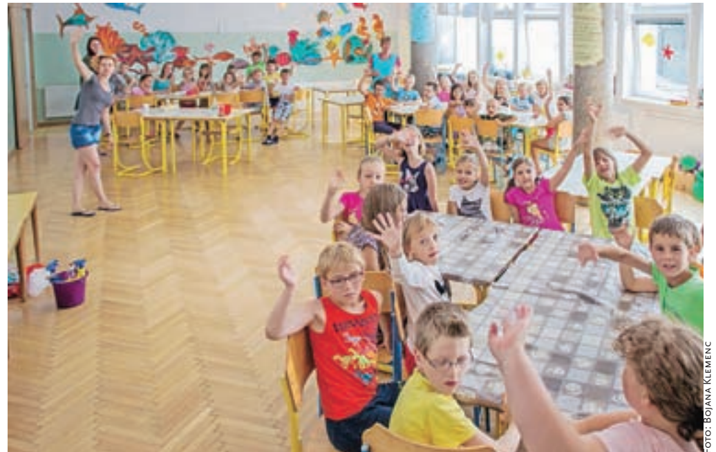
Počitniško varstvo tudi letos poteka v prostorih Osnovne šole 27. julij Kamnik.

Seveda si večina počitnikarjev želi preživeti počitnice na prostem, stran od knjig, morda tudi računalnika in televizije. Kamniški športni klubi in društva celo poletje ponujajo različne športne taborje, na katerih lahko otroci spoznajo novo športno aktivnost oz. poglobijo svoje znanje, ki so ga že pridobili na treningih preko šolskega leta. Nogometni klub Virtus je v prvem tednu počitnic za dečke in deklice organiziral počitniški nogometni tabor Camp Virtus, na katerem so mladi nogometaši pilili nogometne veščine in tekanje za nogometno žogo. Na odbojarskem taboru so igralke in igralci spoznavali trike od-