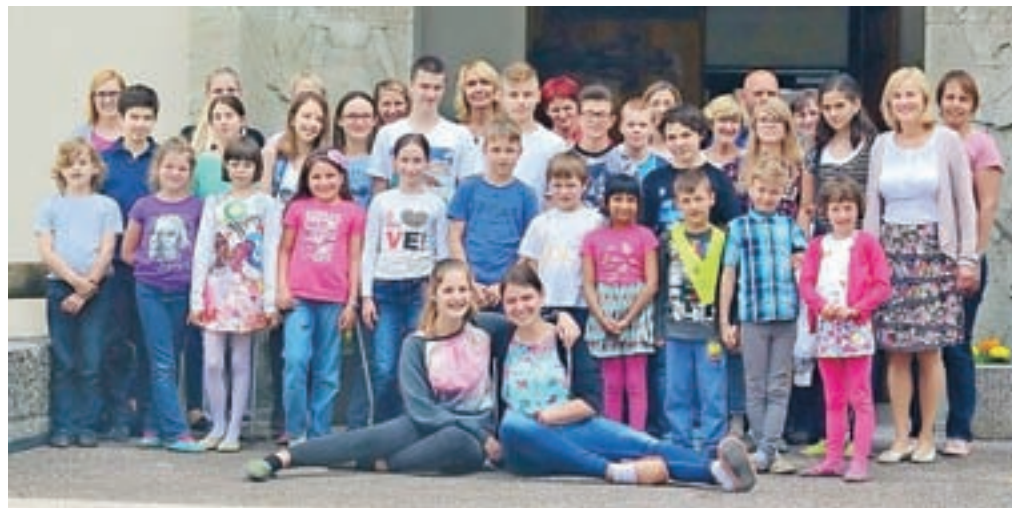
Prejemnikov zlatih priznanj z različnih državnih tekmovanj iz znanja je bilo letos kar enainštirideset.