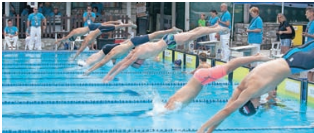
Tudi letos je miting obiskalo več sto plavalcev.