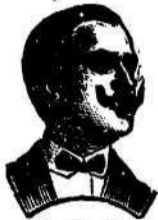
N. Casile Riviera 235 — Napoli.

Najenergijejnše in gotovo se zdravi sifilis s svetovnim sredstvom