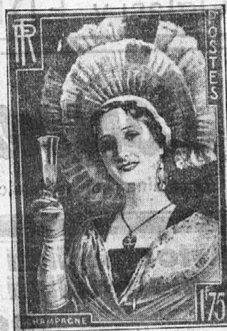
Francija »slavi« šampanjca. V letošnjem letu bo minilo 300 let, kar so prvič začeli izdelovati slavno pijačo šampanjca. V spomin na ta dogodek je Francija izdala posebno znamko.