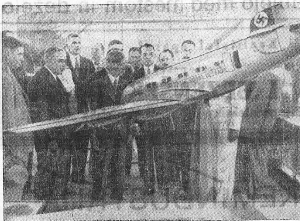
Nj. Vel. kralj Peter II. na obisku mednarodne letalske razstave v Beogradu. Razstavo, ki je bila pred dnevi zaključena, je obiskalo nad 200.000 ljudi. Naš mladi Kralj se je zelo živo zanimal za razna letala in ves tehnični napredek v tej panogi moderne tehnike.