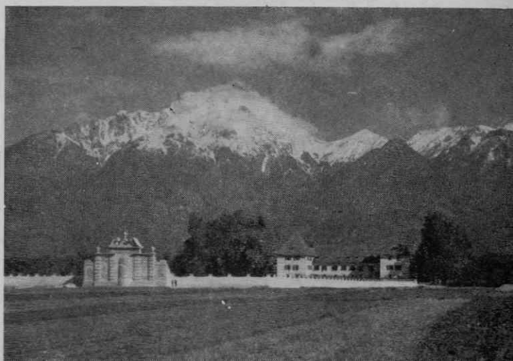
Grad Brdo pri Kranju