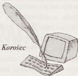
Risba: Tamara Korošec