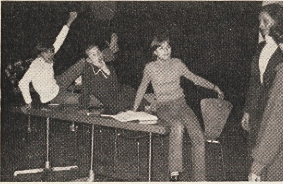
Pustovanje v Rankweilu: Tri nado- budne deklice v šolskem priporu.