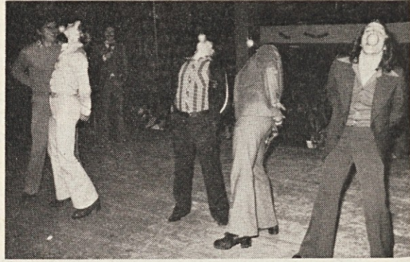
Nekaj fantov skuša brez pomoči rok pojesti jabolko.