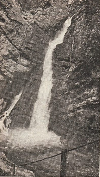
Savica pada 60 metrov globoko v tolmun med skalnimi stenami in se kasneje izliva v Bohinjsko jezero.