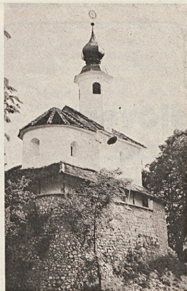
Mali grad na skalnem griču sredi Kamnika je v srednjem veku nadzoroval cesto skozi Tuhinjsko dolino.

božja. V hvaležnosti sem molil Boga ter mu dajal čast, da mi je ta cvet tresel na pusto stezo mojega življenja. Ko je bilo malone že vse odšlo, je prišla iz božjega hrama. Dvignila je pogled ter takoj opazila, da čakam nanjo. Kri ji je zakipela v obrazek in kakor plaha srna je odhitela. Še pogledala me ni, dasi sem se ji ponižno, globoko poklonil.“