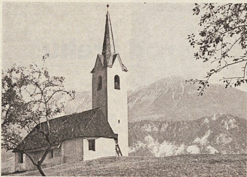
Cerkev sv. Marka v Vrbi s freskami iz 16. stoletja.

SREČANJE VERSKIH ČASNIKARJEV — Kakor že več let zapovrstjo je slovenski metropolit, ljubljanski nadškof dr. Jožef Pogačnik tudi letos povabil vse tiste, ki se znotraj Cerkve na Slovenskem ukvarjajo s časnikarstvom in izdajanjem verskega tiska. Srečanje se je začelo v nadškofijski kapeli z mašo, ki jo je daroval nadškof Pogačnik. Pri maši je nadškof nagovoril časnikarje o veliki važnosti njihovega pastoralnega poslanstva. Po maši je nadškof navzoče povabil k pogovoru in zakuski.