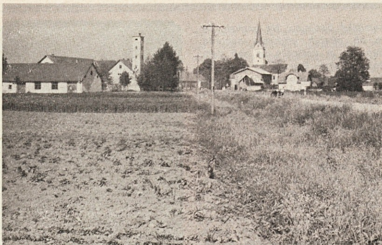
Sv. Lovrenc na Ptujskem polju.