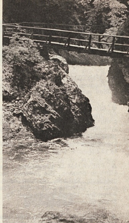
Vintgar je 60 metrov globoko izjedeno korito Radovne v bližini Bleda.