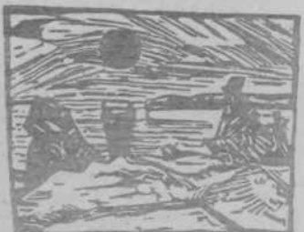
Erich Heckel: Rajstvo sonca. 1914