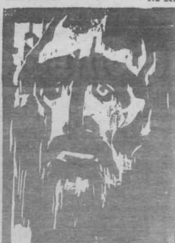
Emil Nolde: Pevci. 1912

Dela in avtorji sodijo v sam vrh svtozne sodobne likovne umetnosti. M R.