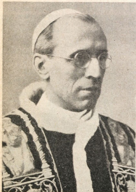
Papež Pij XII.