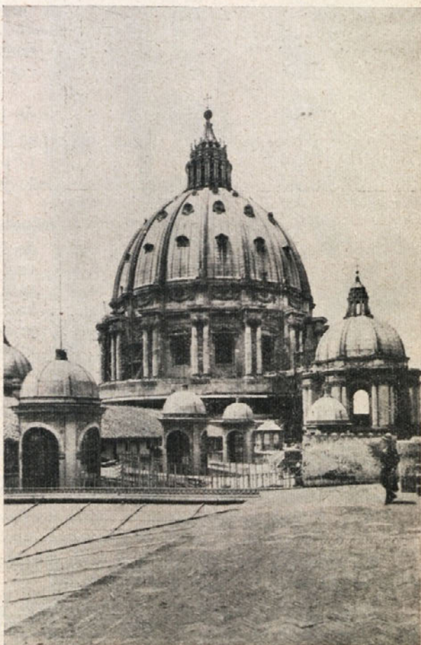
Bazilika sv. Petra v Rimu

Spored vsega potovanja boste dobili priglasenci v posebnih knjižicah.