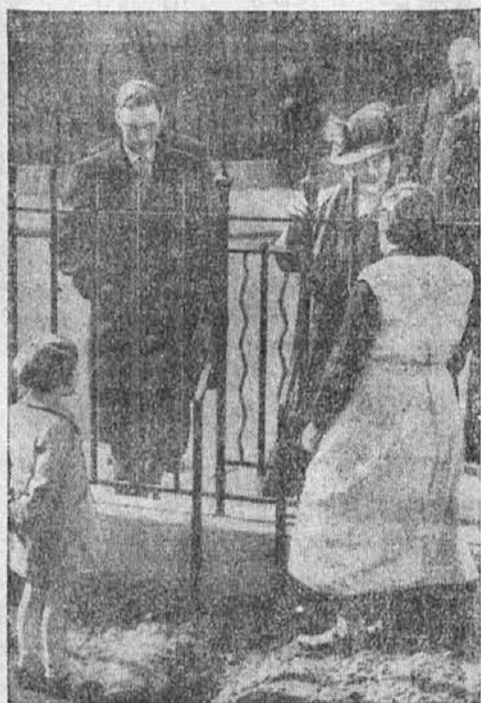
Angleški kralj in kraljica na obisku pri revnih deci.

nil prijatelj vdovi roko in ji povedal, da je on stril svojo dolžnost. — Prijatelj naj boljšega prijatelja pa je bil obenem pred sednik drugega društva. (Pri nas je sploh razširjena ta lepa navada, da je vsak kje predsednik ali načelnik, če ne društva, pa vsaj predsednik odseka. Tako ni nihče manj ko drugi, vsi so srečni, vsak ve že vnaprej, da bodo po smrti slavili njegove predsedniške zasluge.) Ko se je malo utolažil ob prijateljevi krsti, je odšel domov in pomagal še tisto popoldne razobesiti čez ulico široko platno z velikim napisom: PREDPUSTNO RAJANJE. Ljudje so potlej nekaj nergali, da se to ne bi spodobilo zanj, ali za vse ljudi še Bog ni. Kaj, ali je bil prijatelj kriv, če mu je umrl najboljši prijatelj v predpuštenem času? Prijatelj je pač samo povsod napravil svojo dolžnost: umrlega je slavil, kot predsednik drugega društva pa je moral razobesiti vabilo.