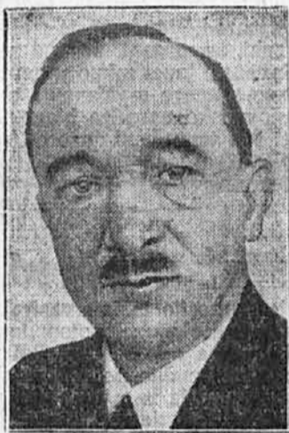
Predsednik čsl. republike dr. E. Beneš.

Spremembe, ki so se dogodile zadnja dva tedna v Evropi, so našle Češkoslo-