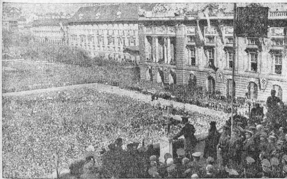
Govor Adolfa Hitlerja na Dunaju. Pogled na zbrano množico na trgu Neznanega vojaka.