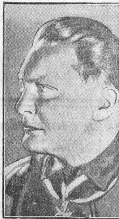
Maršal H. Göring.

Po končanem plebiscitu v Nemčiji bo sredi aprila obiskal Jugoslavijo maršal Herman Göring, ki namerava v naši državi prebiti svoj krajši dopust. Koncem aprila pa bo obiskal Beograd nemški zunanji minister Ribbentrop, ki se bo ob tej priliki sestal z dr. Stojadinovićem. — Za isti čas tudi napovedujejo jugoslovansko-nemška pogajanja zaradi povečanja izvoza našega lesa v Nemčijo.