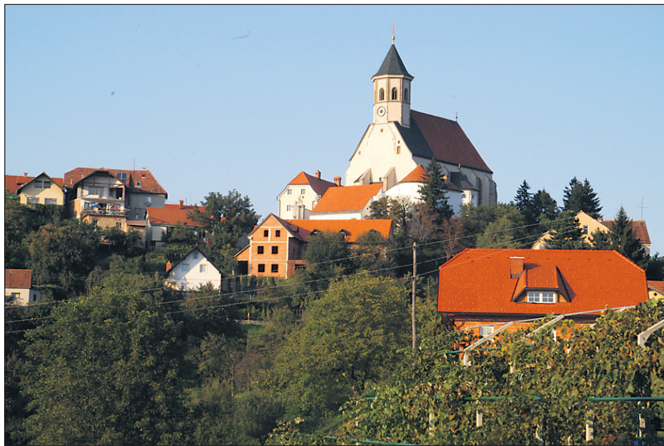
Eden osrednjih letošnjih projektov v občini Majšperk bo celostna ureditev turistične infrastrukture na Ptujski Gori.

Središče ob Dravi • S seje občinskega sveta