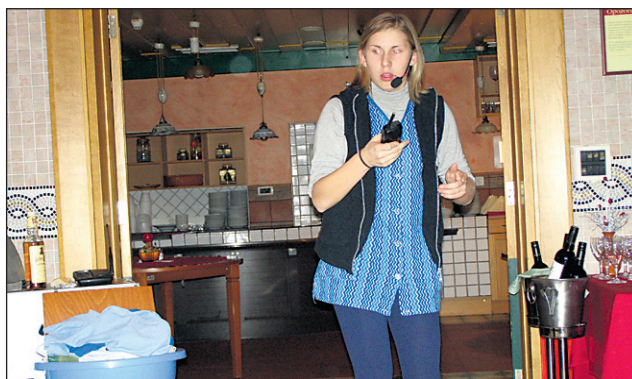
Med čiščenjem Marija izve kopico sočnih podrobnosti o družini, pri kateri dela.