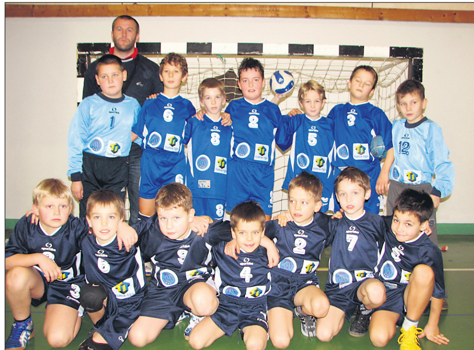
Mladi ormoški rokometarji dosegajo zelo dobre rezultate na turnirjih doma in v tujini.