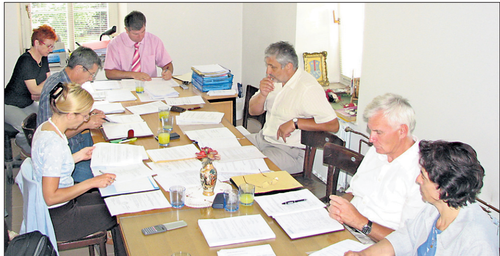
Odloka o ustanovitvi Zdravstvenega doma Središčani niso podprli.