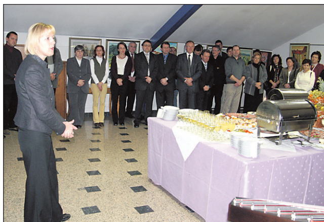
Županja občine Majšperk je številne goste in poslovne partnerje pozvala k uspešnemu in tvornemu sodelovanju tudi v letu 2008.

Sicer pa je bilo minulo leto za občino Majšperk investicijsko zelo pestro ter povezano s številnimi dogodki, saj so