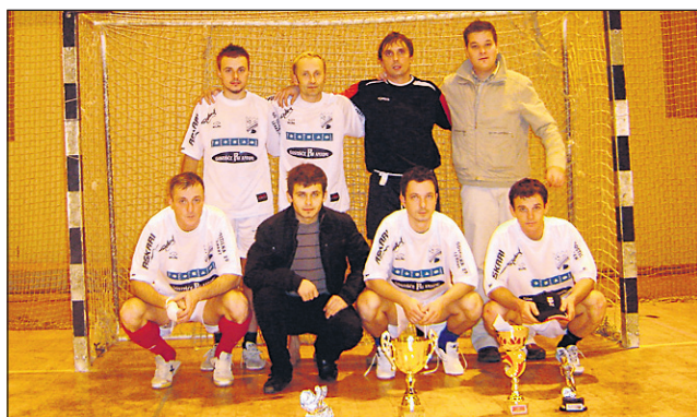
Zmagovalna ekipa Linde plin Ptuj

magali kar s 5:0. Slednjim se je poznala utrujenost tudi na tekmi za 3. mesto, ki so jo zasluženo dobili igralci ŠD Rim.