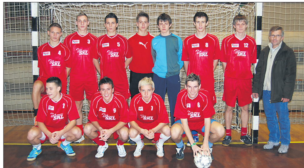
Nogometna ekipa Gimnazije Ptuj, zmagovalka področnega prvenstva

V 1/4 finale se uvrsti prva ekipa, ki se sama prijavi za nadaljnje tekmovanje.