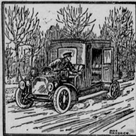
Kje je vendar ostal moj gospod?