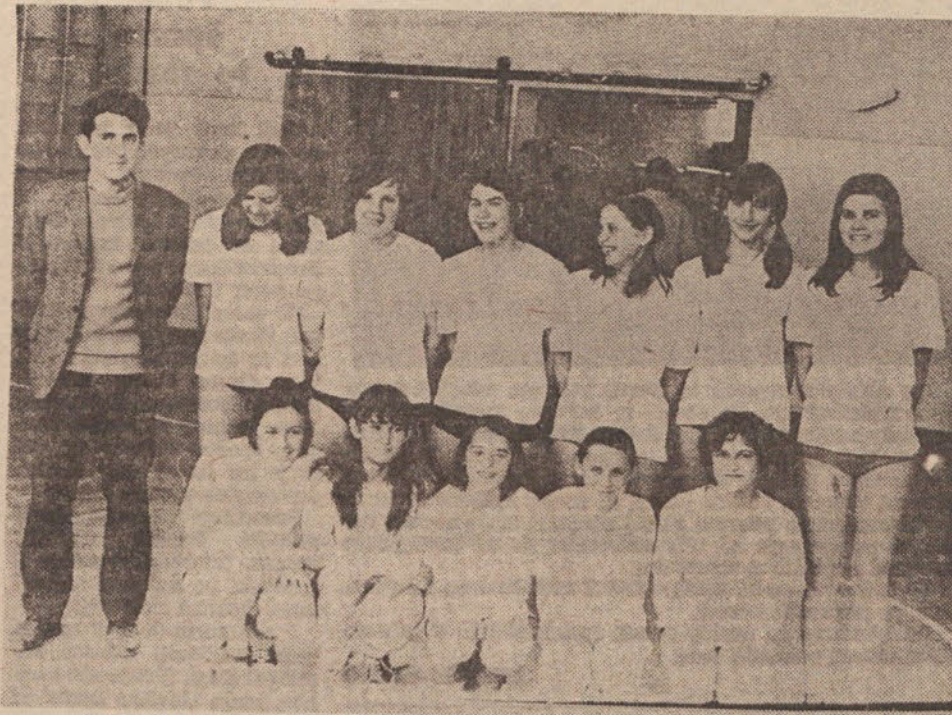
Košarkarska ekipa osnovne šole »Danile Kumar«

To tekmovanje je bilo istočasno tudi prvenstvo ljubljanskega gimnastičnega centra — torej izpit za udeležbo na republiškem prvenstvu. Naši pionirji so s svojimi ocenami na posameznih orodjih dosegli 83,9 odstotkov in s tem zadostili predpisanih normi. Vrsta pionirk I. razreda, ki se je zdaj prvič udeležila tega prvenstva, pa je zasedla 5. mesto. Ker ni dosegla zahtevane norme, bo na bližnjem gimn. centru za ostale oddelke poizkusila srečo z vajami nižjega razreda.