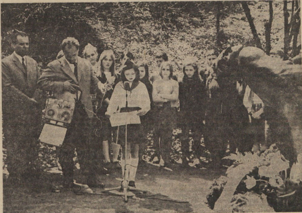
Svečanost ob spomeniku v Gramozni jami ob pohodu pionirjev

čestitamo ob 9. maju dnevu zmage in prazniku Ljubljane