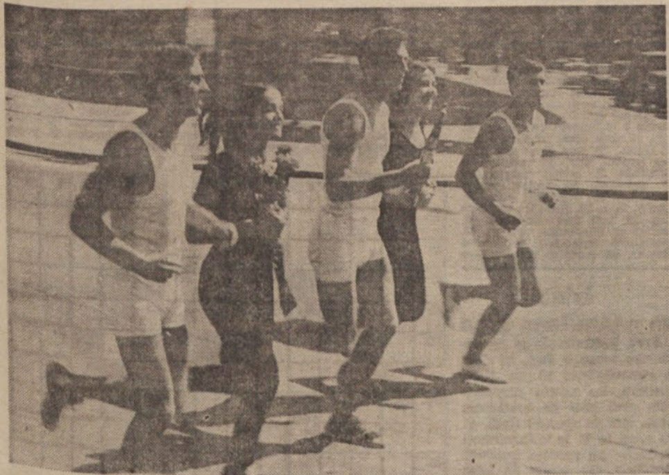
Telovadci Partizana Bežigrad v letošnji Titovi štafeti

I. REPUBLIKSKA LIGA (MOSKI) 11. maja Sava : Braslovče, 18. maja Sava : Kočevje, 25. maja Maribor : Sava, 1. junija Sava : Kanal, 8. junija Izola : Sava, 15. junija Sava : Mislinja, 22. junija Kamnik : Sava.