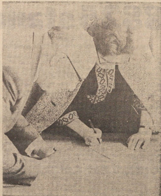
Odborniki in delegati so izvolili tri zvezne poslance in sedem republiških poslancev