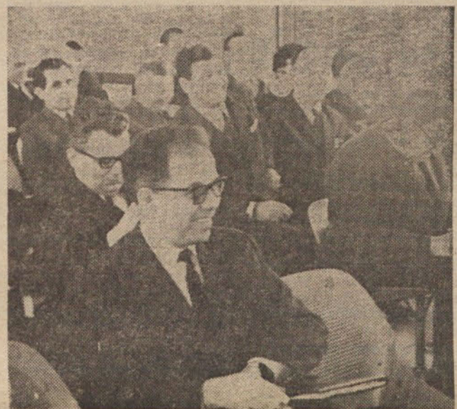
V skupščini je mnogo novih obrazov