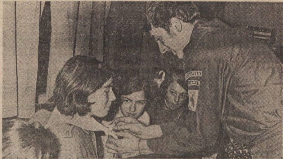
Ob sprejemu v taborniško organizacijo

Kdor pozna skromne in delovne tabornike Savskega odreda, bo priznal, da si kipa ilegalca niso priborili z besedami, ampak z dejanji. Njihovo delo ni vidno samo znotraj taborniške organizacije, pač pa tudi na terenu, v Savskem naselju. Ne ustrašijo se tudi najzahtevnejših nalog. Povsod jih spoštujejo in jih imajo radi: v Divači, v Otočju v Liki, Borovu, Jajcu, Ljubljani in drugod. Bratstvo in enotnost pri njih prehajata od besed k dejanjem.