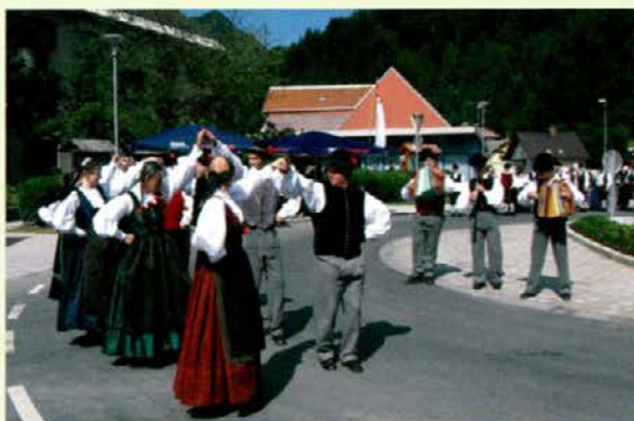
Na trgu v Črni je zaplesala domača folklorna skupina Gozdar

Ljudje, ki se ukvarjajo s kulturo predvsem ljubiteljsko, so prijetni ljudje. Imajo