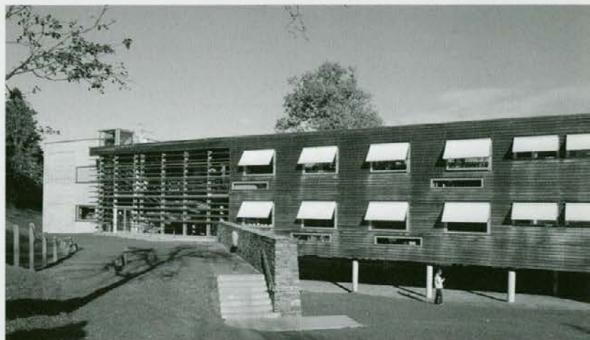
Zadnji del zgradbe: lesena fasada, stara deset let, nikoli pobarvan les