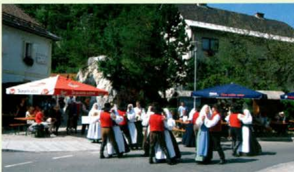
Veteranska folklorna skupina FD Kres se je zavrtela v neposredni bližini črnjanskega medveda