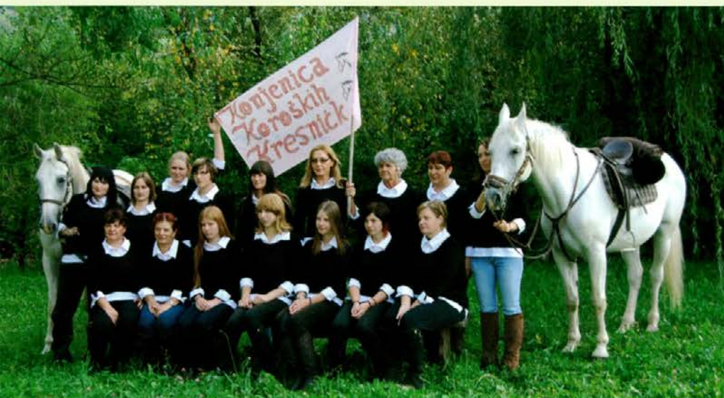
Pred pričetkom ježe smo naredile skupinski posnetek za spomin