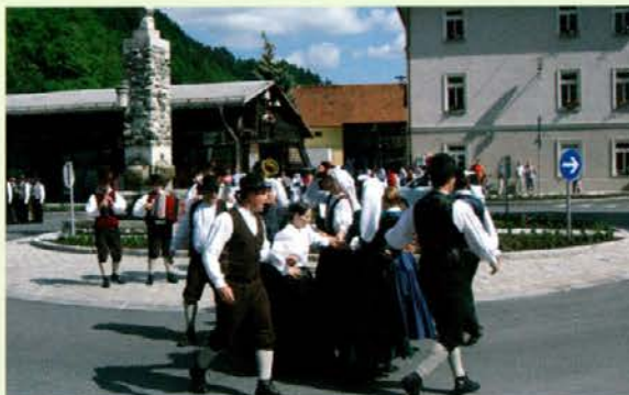
Živahno je zaplesala Folklorna skupina Oljka iz Šmartna ob Paki