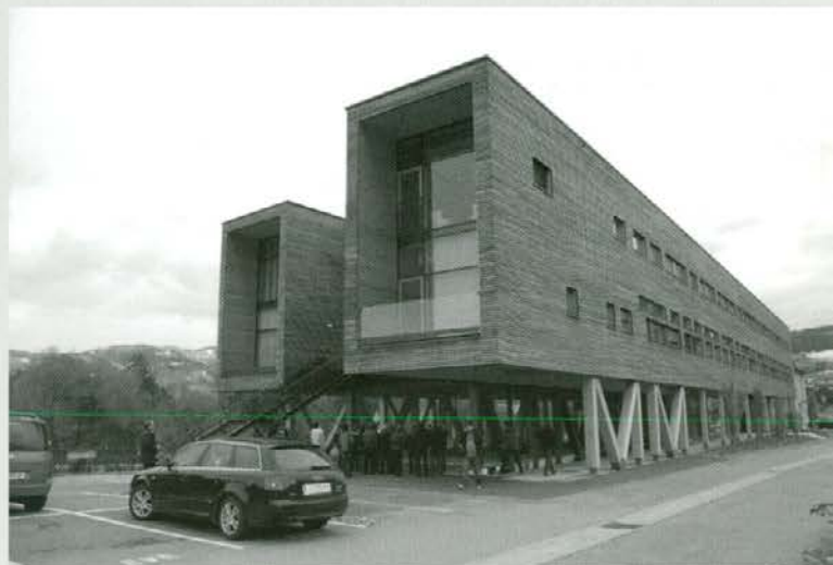
Primer gradnje na »pilotih« poslovna zgradba