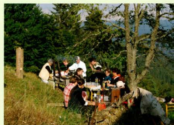
Spremljevalci v vozilih so pripravili večerjo na inovativno izdelanem štedilniku na prostem in naredili bakle na starodaven način - izdolbena debela, zalita s smolo, ki smo jih zvečer slavnostno prižgali.