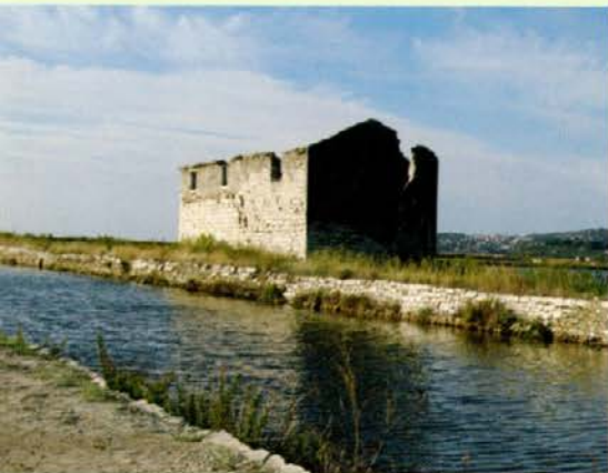
Soline v sončnem zahodu

Sindiklat Gozdnega gospodarstva Slovenj Gradec, d. d., je v oktobru organiziral izlet na Primorsko. Prva postojanka našega enodnevnega izleta je bil grad Socerb, od