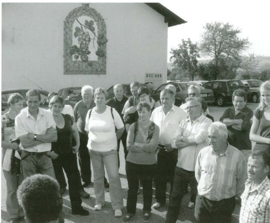
»Bobovci« pri vinogradniku

Treba je poudariti, da je bila predstavitev kakšnih sto vrst raznega sadja, tako v estetskem kot v strokovnem smislu pripravljena tako, da je ponudila pester pregled najbrž večine tistega sadja, predvsem starih sort, kar jih še premore tukajšnje okolje. Obiskovalci so videli nekatere zelo zanimive sorte, tudi poskusili so večino, kar še premorejo naši sadovnjaki. Organizatorji vsekakor zaslužijo priznanje, saj so dobro obredli vso širno, tudi planinsko okolico in zbrali