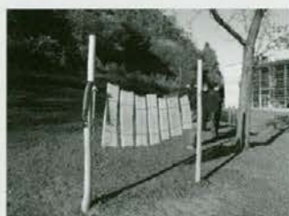
Med drugimi lesenimi igrali je tudi ksilofon