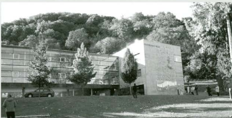
Osnovna šola Wildon, čelni del stavbe, na leseni fasadi so plezalni oprimki, spodaj zaščiteni s stekleno zaporo