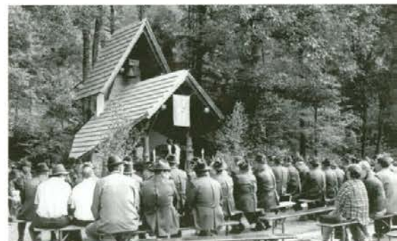
Lovska maša ob ekološki kapelici sv. Antona Padovanskega v Bistriškem jarku