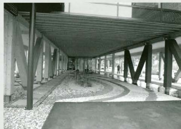
Pod zgradbo "na pilotih" je mično urejen park z vodo in kamenjem