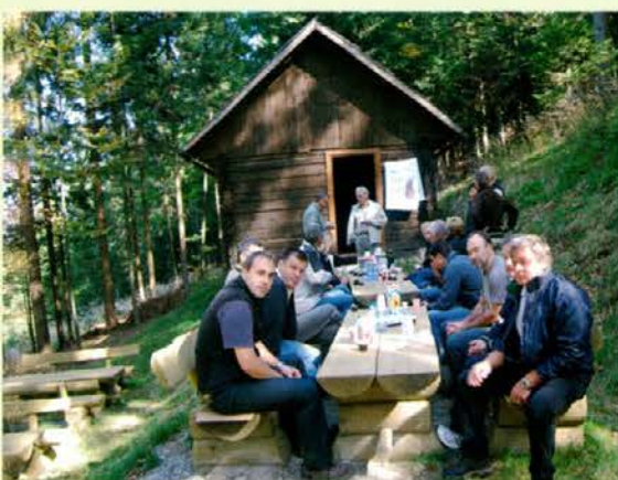
Pred »Bukovo koč«