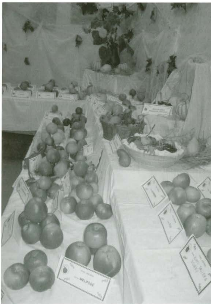
Razstava v Dravogradu