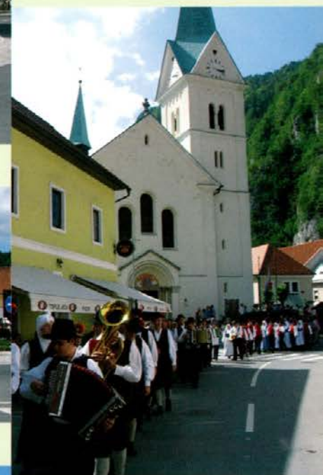
Folklorna gauda v Črni na Koroškem

bogastvo, ki ni otipljivo in se ne da izmeriti. Teh pa je v črnjanski občini veliko. Kar nekaj je še družin na kmetijah, kjer se tradicija družinskega kulturnega udejstvovanja nadaljuje. Kultura je del vsakdanjega življenja. Tega se zavedajo v občinski skupnosti in Turističnemu društvu Črna na Koroškem, še posebno pa v Zvezi kulturnih društev Črna. Vsem se za pomoč pri organizaciji folklorne prireditve »Na gaudi se dobimo« v imenu Folklorne skupine KD Gozdar prav lepo zahvaljujem, bralce pa že zdaj vabim, da se udeležijo folklorne »gaude« v letu 2010.