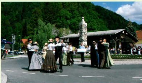
Na krožišču v Črni na Koroškem je bilo dovoljeno zaplesati Folklorni skupini Dravca iz Dravograda