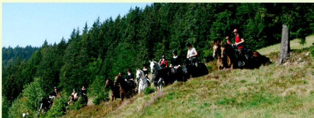
Pogled na Roglo pred odhodom čez Pohorje do Pungarta in v dolino