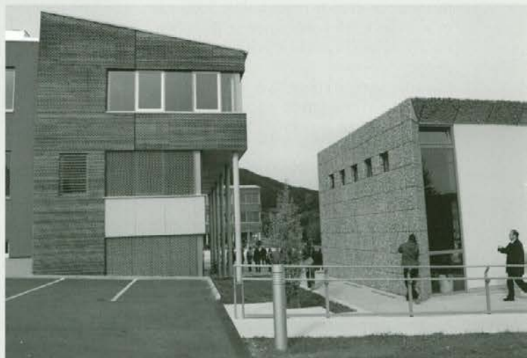
Občinski center Statteg pri Gradcu, kombinacija betonskega skeleta, lesena fasada in pretežni del notranjosti zgradbe. Desno je kapelica; zunanji obod je zgrajen iz kamena v mrežah, ki so ga nabrali krajanji sami in s poenostavljeno gradnjo pridali svoj prispevek k unikatnemu videzu.