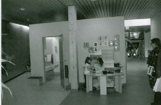
Vsi prostori so izkoriščeni kot igralni, delovni ali gibalni deli objekta