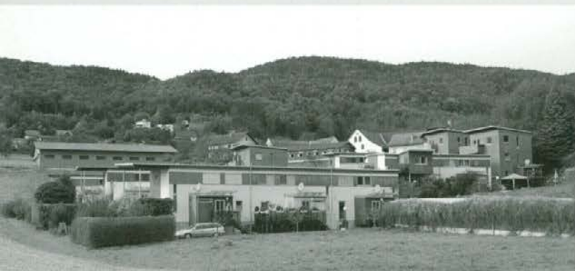
Naselje hiš z lesenimi fasadami v Stattegu