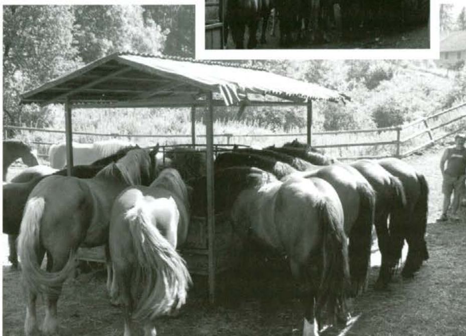
Briga se nahaja globoko v Kočevju, tako da se žrebci pasejo na mogočnih površinah Kočevja