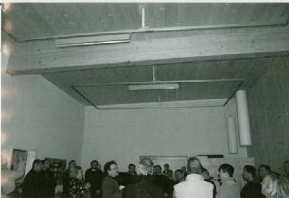
Svetila so vgradili kot viseče skulpture