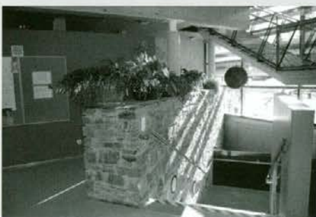
Ostanek starega grajskega zidu so nadgradili na površje, ga speljali v notranjost objekta in tako krasi prostor. Notranjost šole je pretežno iz lesa, čelni del pa ima vgrajenih veliko oken, ki dajejo veliko svetlobe.