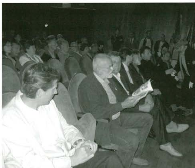
Pomembni gostje na slavnostni akademiji