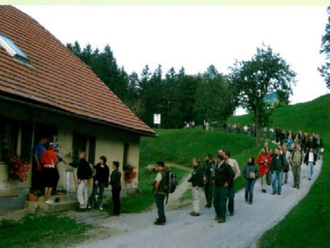
Evropski gozdarji prhajajo na Sgermovo kmetijo na Orlici na Pohorju

V dneh od 24. do 27. 9. 2009 je v Sloveniji potekala jubilejna konferenca nevladne organizacije Pro Silva Europe, ki je bila ustanovljena pred 20 leti v Sloveniji in razvija sonaravno in ekonomično gojenje gozdov. Konference se je udeležilo 120 gozdarskih strokovnjakov iz več kot 20