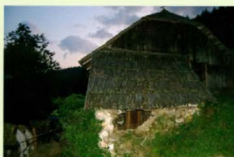
Prenočišče na zapuščeni Hriberškovi domačiji, ki že trinajst let samuje