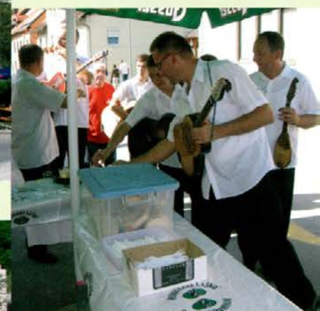
Nastopajoči so bili postreženi kar med povorko