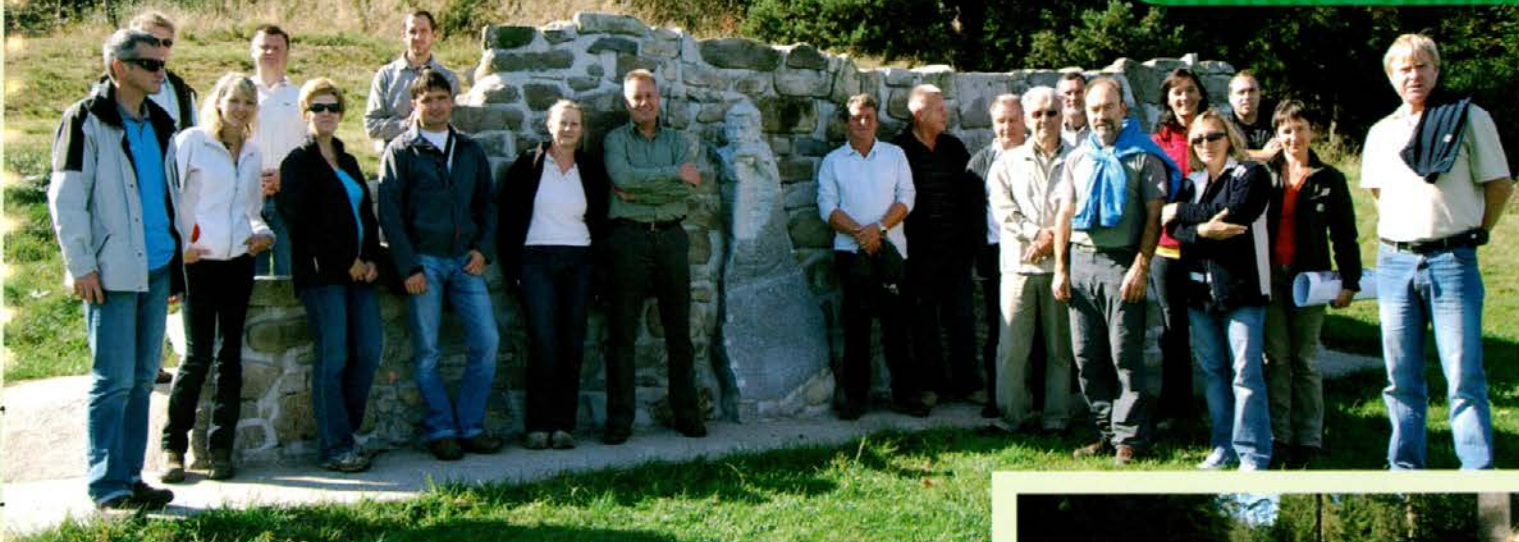
Ob Pahernikovem spomeniku, kjer je nekoč stalo gospodarsko poslopje