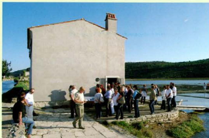
Zbor pred solinarsko hišo

Naši fantje ob krkavškem kamnu, ki naj bi moškim dajal posebno moč