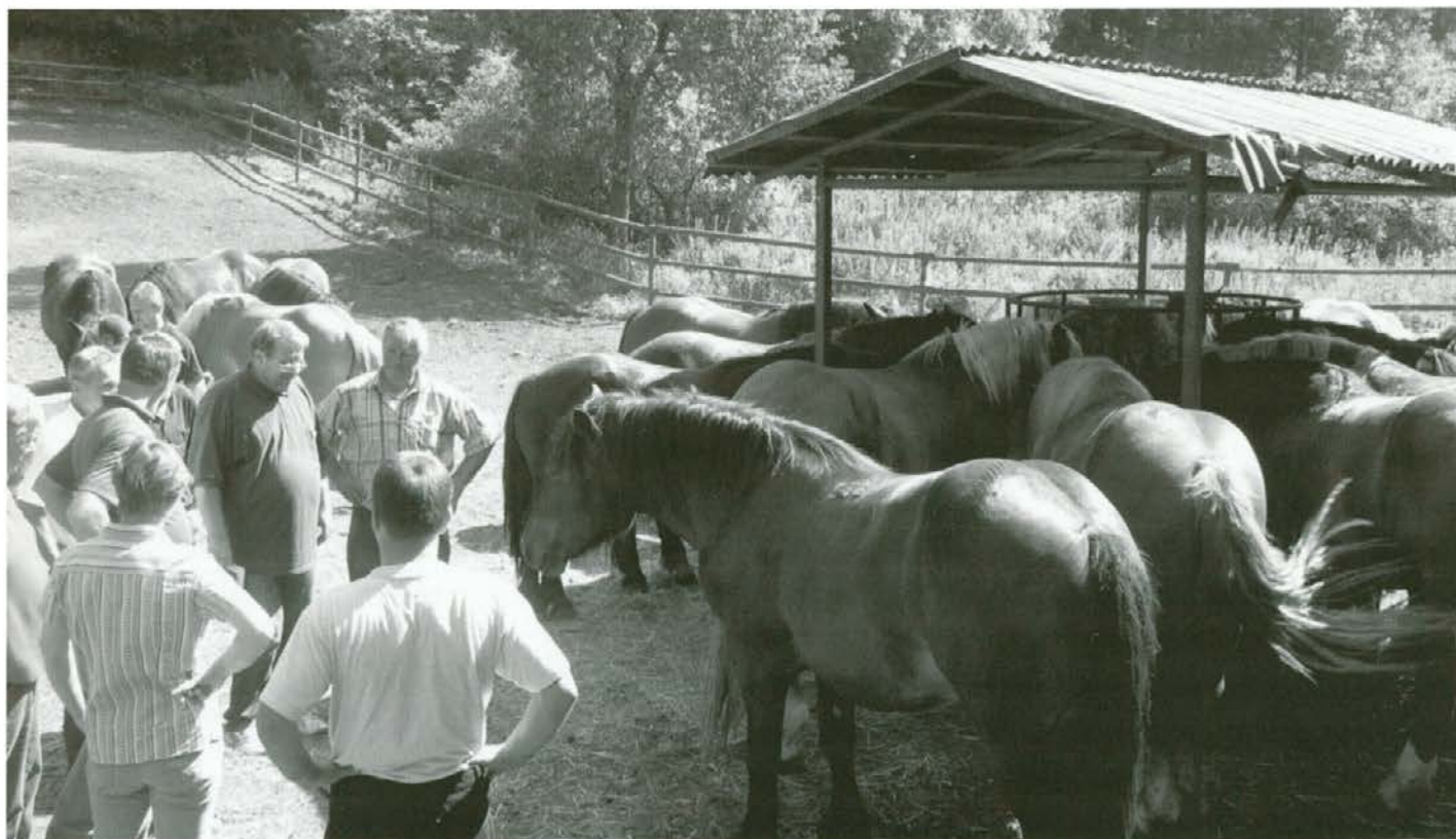
Mladi žrebci bodo v Brigi še eno leto