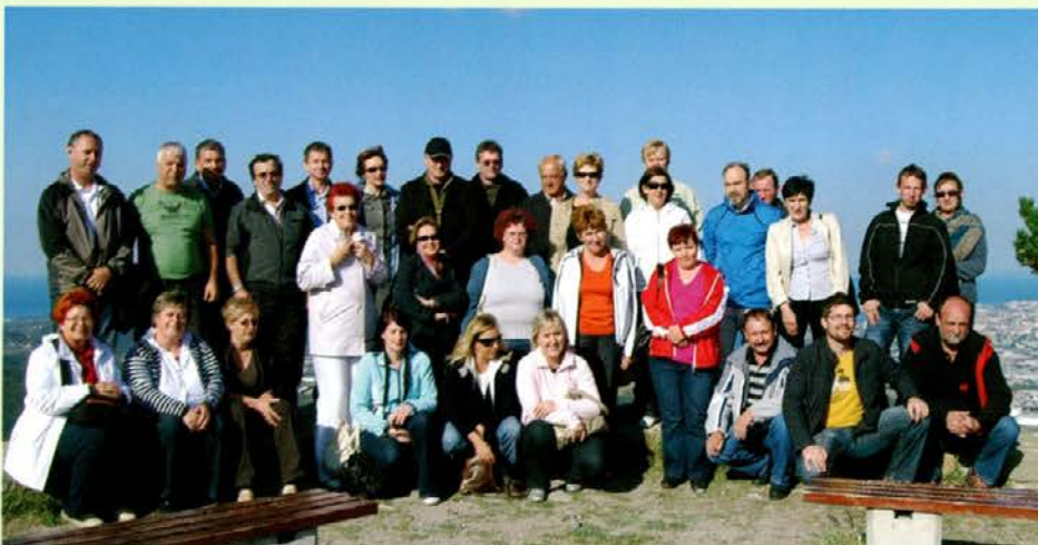
Socerb nad Tržaškim zalivom