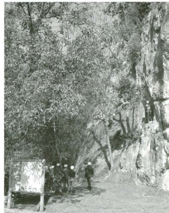
Plezališče na Kalvariji v Radljah ob Dravi

Malo drugače so sproščali v septembru svojo telesno in umsko energijo poklicni gozdni delavci. 11. in 12. kimavca se je na 7. državnem tekmovanju gozdnih delavcev v Ribnu pod Ribensko goro preizkusilo več kot sedemdeset profesionalnih gozdnih delavcev v zanimivih sekaških disciplinah. Med ekipami gozdnih gospodarstev Slovenije so se odrezali tudi gozdni delavci GG Slovenj Gradec. Z veččinami, katere »holcarji« uporabljajo pri vsakdanjemu nevarnemu in vse manj cenjenemu ter vrednotenemu delu, sta se tekmovalno spoprijeli ekipi Srednje gozdarske šole Postojna in Biotehniške fakultete – gozdarski oddelek. Gozdarsko tekmovalno srečanje je organiziralo Gozdno gospodarstvo Bled ob pomoči Gozdarskega društva Bled. Naslednje