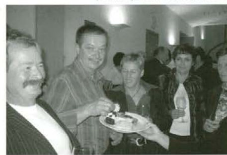
Druženje planincev po končani akademiji v avli kulturnega doma