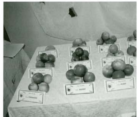
Največ je bilo seveda jabolk