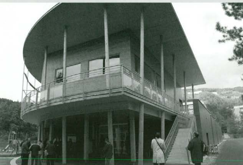
Otroški vrtec v Leobnu, postavljen ob levem bregu Mure ob mestnem sprehajališču. Objekt ima obliko ladje. Arhitekt je dobil navdih v okolju, saj po Muri plovejo manjša plovila. Otroci, ki obiskujejo ta vrtec, živijo v kvalitetnem, zdravem in estetskem okolju. Neposreden stik z lesom lahko občutijo in spoznavajo že v svojih prvih letih življenja.