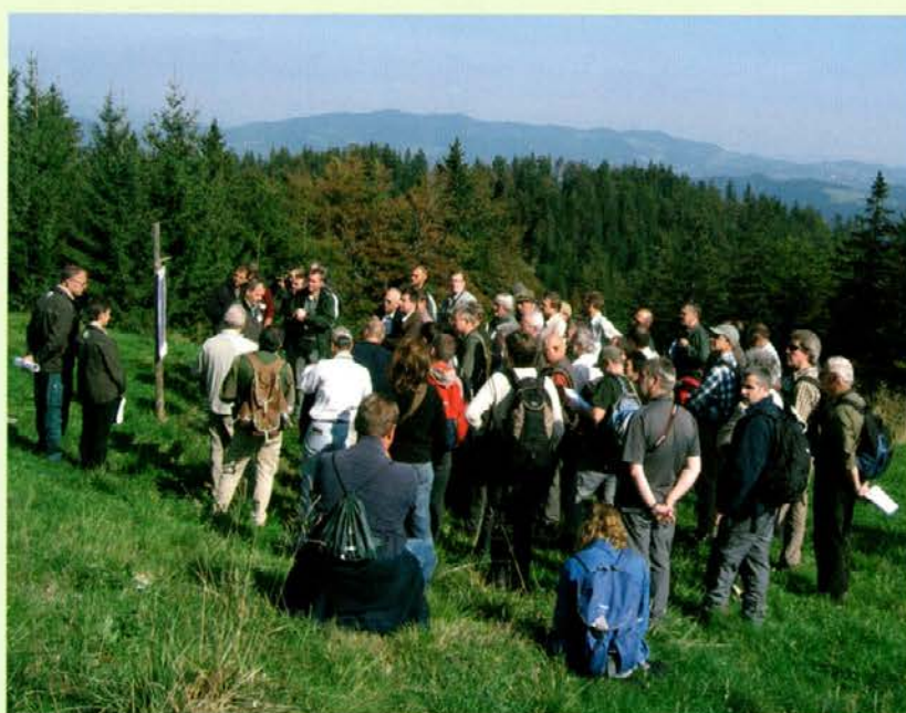
Udeleženci konference Pro Silva na Samčevem v osrčju Pahernikovih gozdov