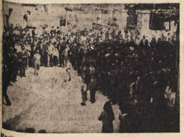
Menočica Kraševcev, ki se je udeležila prvomajske proslave