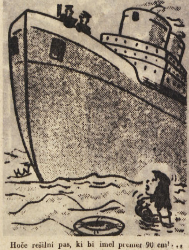
Hoče rešiti pas, ki bi imel premer 90 cm!..