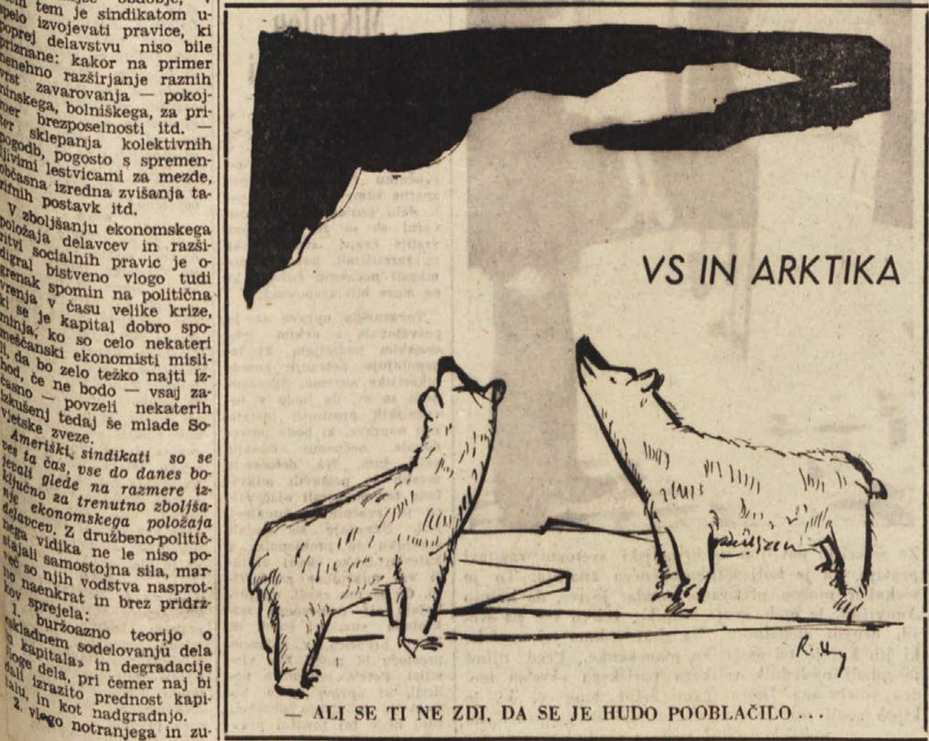
— ALI SE TI NE ZDI, DA SE JE HUDO POOBLAČILO ...

Skupno sporočilo jemlje znanost na znanje, da je sovjetska vlada pripravljena razpravljati o bistvu vprašanih med pripravljanimi razgovori, in pravi, da bi moral pri teh razgovorih predvsem govoriti o dnevnem redu konference najvišjih, zatem pa o dnevu, kraju in udeležencih konference zunanjih ministrov. Nota se takoile zaključuje: »V zvezi s tem so trje veleposlaniki pripravljeno stati se v ta namen s sovjetskim zunanjim ministrom.« V noti je med drugim tudi rečeno: »Vlade ZDA, Francije in Združenega kraljestva so z obžalovanjem sprejele na znanje, da je Sovjetska zveza s svojo spomenico od 26. aprila zavrnila njih predlog za skupne sestanke med tremi zahodnimi veleposlaniki in sovjetskim zunanjim ministrom, katerih namen naj bi bil začeti pripravljeno delo za konferenco najvišjih. S takim ravnanjem je sovjetska vlada brez potrebe postavila oviro za nadaljevanje te naloge.« Kakor sovjetska vlada poudarja v tej spomenici, se ni v ničemer napredovalo, da bi se sporazumeli o določitvi vrste vprašanih, ki naj bi jih obravnavali oziroma ugotovili, katera od teh nudijo možnost sporazuma. Tri države niso spremenile svojega mnenja, da bi lahko bolj naglo napredovali s skupnimi sestanki, kakor pa s ločenimi razgovori. Toda, ker želijo nepredovanje pri omejenih razlogih in ker se sovjetska vlada strinja da veleposlaniki razpravljajo o bistvu vprašanih, so pripravljene sprejeti postopek ločenih razgovorov, kakor sovjetska vlada bolj želi.