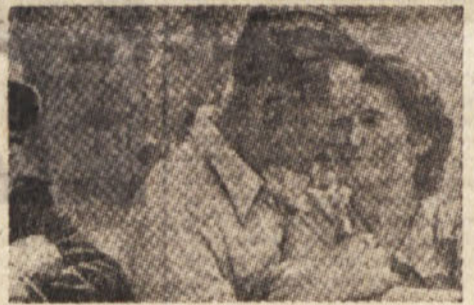
Rosen in sentimentalni ruski parček

Pošten človek se tudi v ljubezni za vedno odgovornosti in dolžnosti do svojega partnerja. Večina v naših krajih pač ne najde nad tem, če vidi dvoje zaljubljenec, ki si izkazuje čustva v spodobni meri, prav nič grdega, prav nič spotalktivnega. Je pa od obeh zaljubljenecov odvisno, v koliko je njun odnos re-