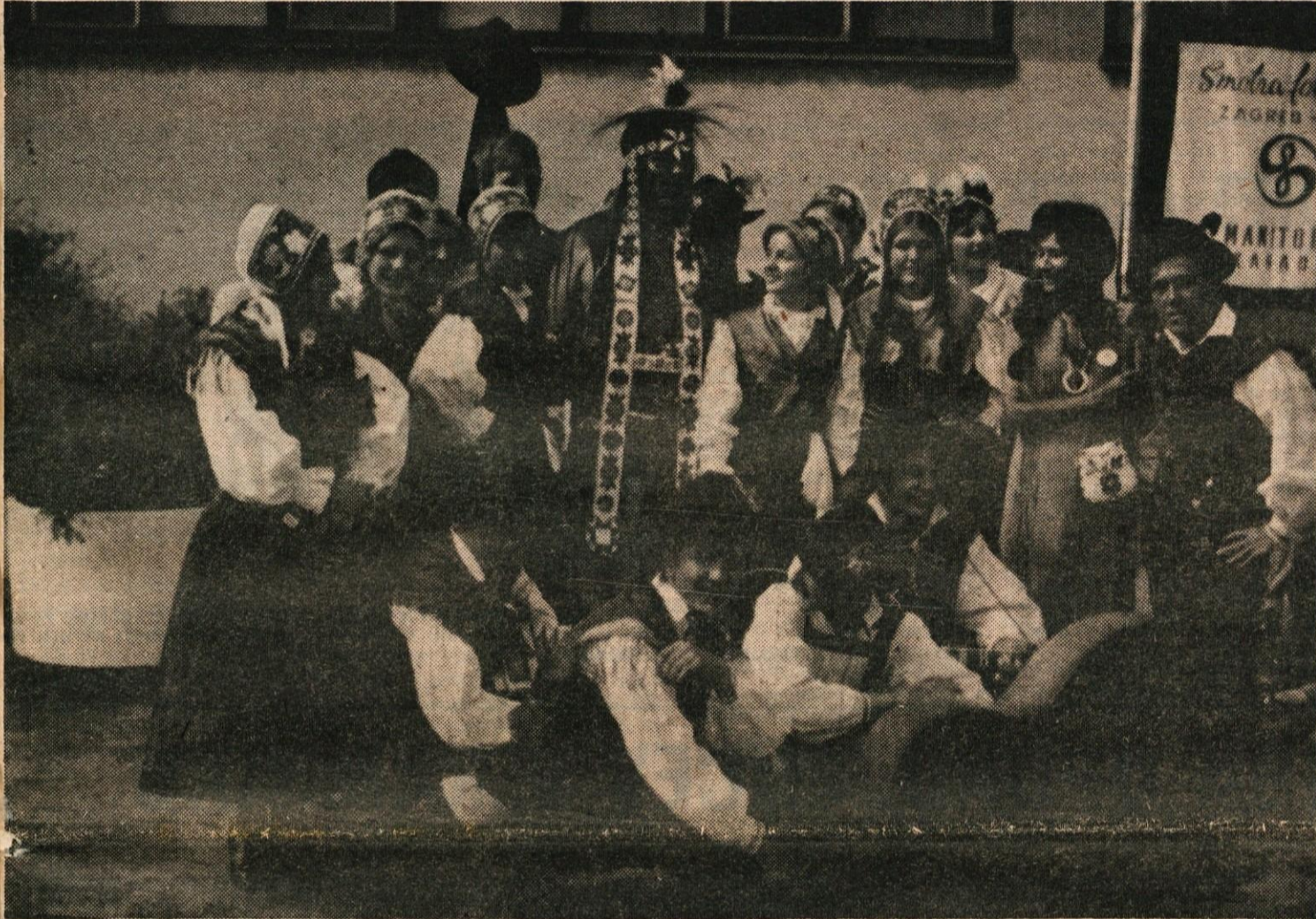
FOLKLORNA SKUPINA IZ KAMNIŠKE BISTRICE JE LANI Z NARODNIMI PLESI GOSTOVALA V MNOGIH KRAJIH DOMA IN TUDI V TUJINI. NAŠA SLIKA JE Z LANSKEGA FOLKLORNEGA TEKMOVANJA V ZAGREBU. O OBČNEM ZBORU TURISTIČNEGA DRUŠTVA KAMNIŠKA BISTRICA POROČAMO NA 6. STRANI