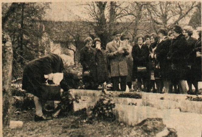
OB LETOŠNJEM DNEVU ŽENA SO OBČINSKE KONFERENCE SZDL GORENJSKIH OBČIN PRIPRAVILE NA BLEDU SREČANJE DRUŽBENIH DELAVK IN AKTIVISTK. NA SLIKI: UDELEŽENKE SREČANJA IZ NAŠE OBČINE SO OBISKALE TUDI GROBIŠČE TALCEV V BEGUNJAH