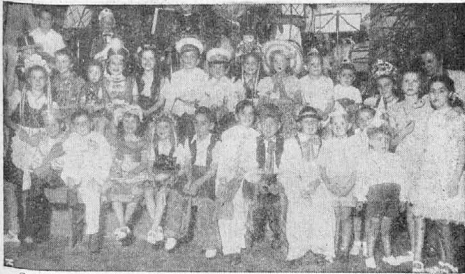
Skupina malčkov v D. K. D. "Ljudski Oder"

Zabave, izvzemši na pondeljek in ždanje nedelje, so bile še precej dobro obiskane. Tudi še precej mask smo opazili med navzočimi. Posebno pa pridne mamice so pripra-