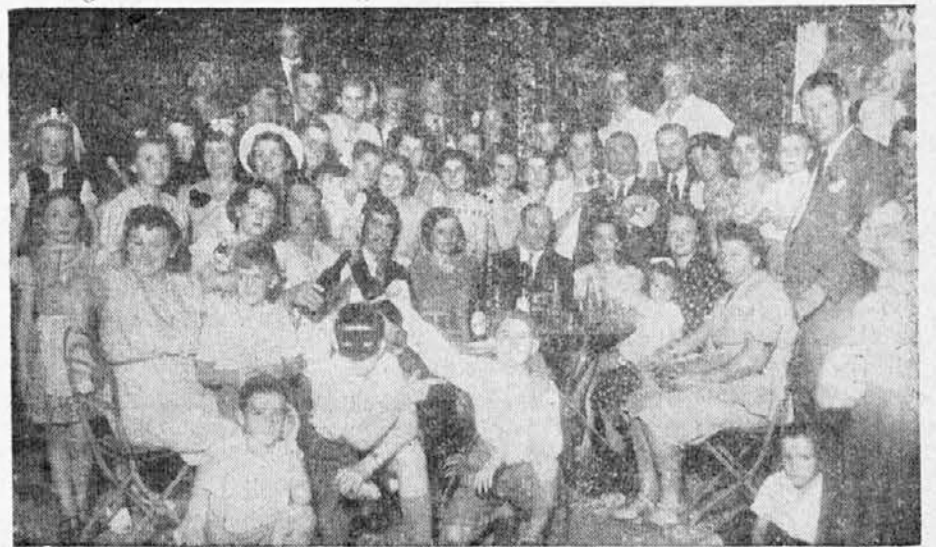
Del prisotnih na pustni zabavi v G.P.D.S.

ne napravi ni pa vredno delati." To je tudi resnica. Pa saj ne ravno tako pleše v navadni, kakor v maskeradni obleki. Mladini bi tu priporočali v bodoče da