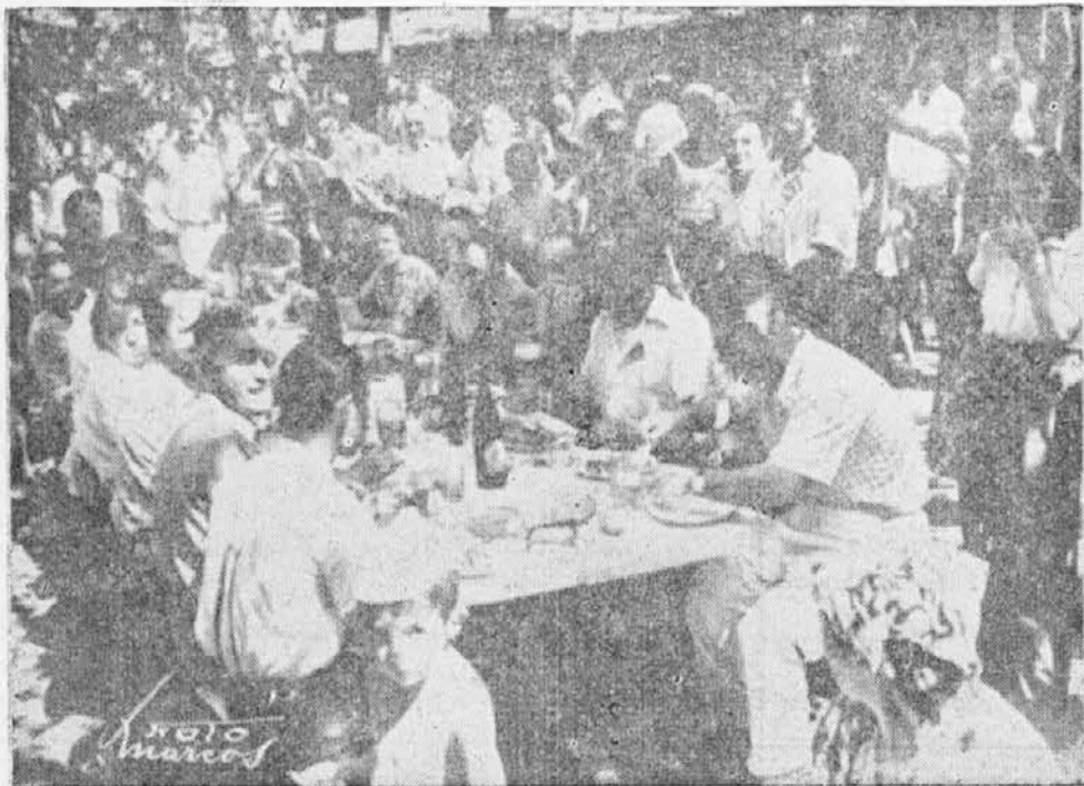
Opoldne pri kosilu na pik-niku Slovanov

Ob uri 17.30 je brat Šostakovski nazdravil: naši drugi domovini Argentini, nakar je nazdravil Rdeči Armadi ob priliki svoje 29. letnice ter naprosil prisotnega tajnika Sovjetskega poslaništva naj odpošlje častitke in solidarni pozdrav isti v imenu tukajšnje velike slovanske družine; končno je