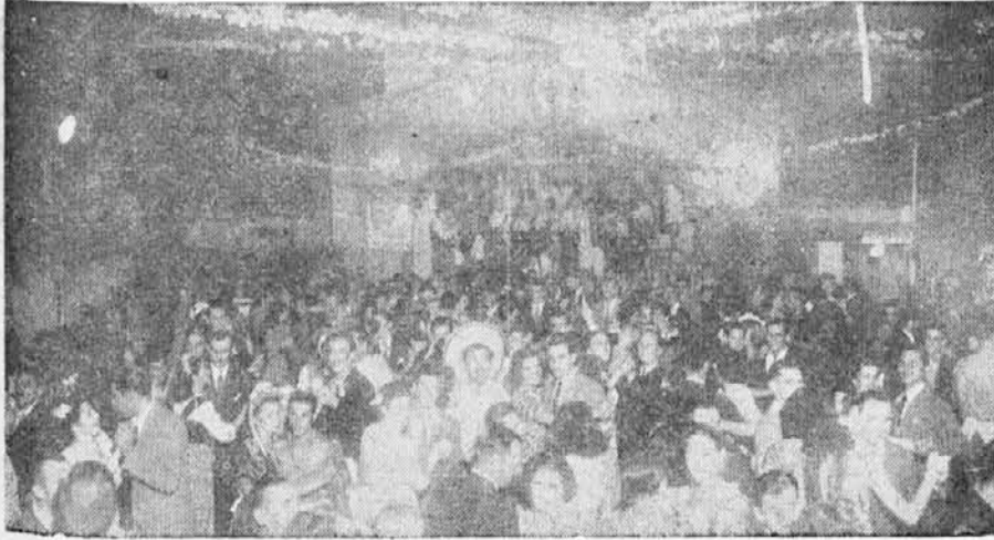
Iz pustne zabave v D. K. D. "Ljudski Oder"

nad odrom lep star mlin na veter. Ni bil pa na veter, ker čeprav je pust, za norca imeti se ne pustimo, bil je pa napravljen, da je motor gonil veternice. Pa nič za to, dobro se je sukalo in ker je bil tudi lepo razsvetljen in na visokem se ga je opazilo iz