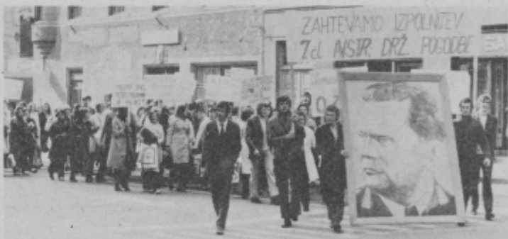
Ptujška mladinska protestna povorka