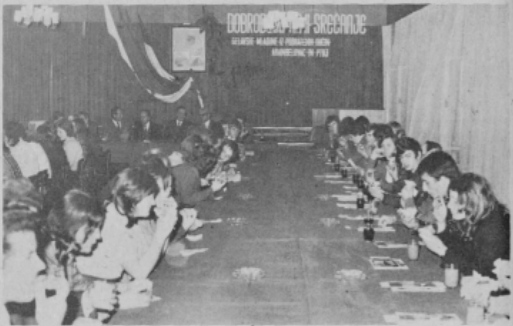
In skovale so se prijateljske vezi...