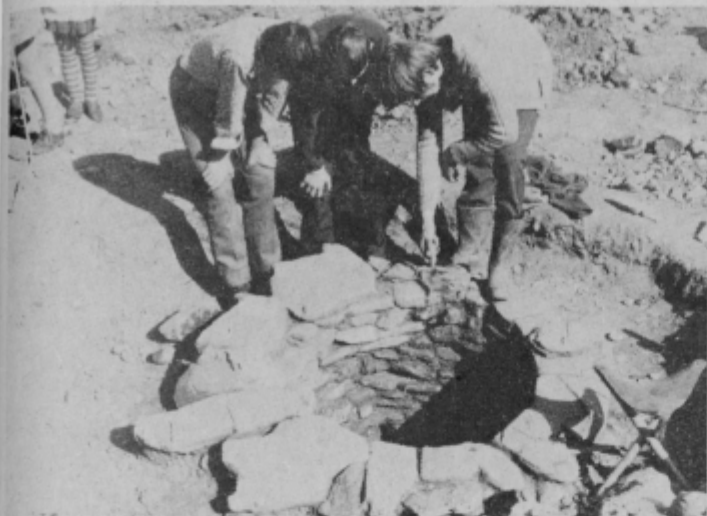
Rimski vodnjak, ki so ga našli v Spodnji Hajdini.

V zadnji številki Tednika smo poročali o najnovejših arheoloških najdbah na gradbišču nove ceste Macelj-Ptuj v Spodnji Hajdini pri Ptujju. V tekstu in sliki smo vam prikazali tudi glavo leva, izdelano iz pohorskega marmorja.