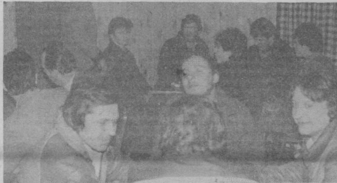
Mladi so aktivni, ker pa nimajo svojega prostora se za akcije dogovarjajo kar v bifeju Hrovat, ki so ga pred nedavnim odprli.

cesti bi morali tudi prelagati vodovod. Trenutno je predračun 300 milijonov din. Vpise zemljišč ob premikih in razširitvah cest izvaja občinska geodetska uprava. Za vodo smo naredili raziskave do leta 2000. Korinj in Kamni vrh imata 300 m višinske razlike in vodovod tu ne bo nikoli rentabilen, saj so projekti tehnično izredno zahtevni pa tudi cena elektrike za črpanje je velika. V 10 letih smo od 45% dvignili na 85% krajev v občini, ki imajo vodovod. 5 din od kubičnega metra vode plačujemo za razširjeno reprodukcijo.« Jože