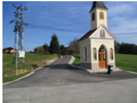
Obnova kapele v Sp. Ključarovcih