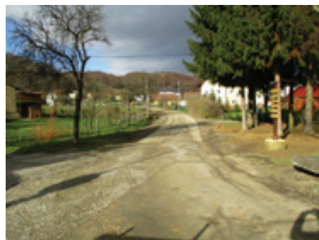
Izgradnja kanalizacije Sodinci