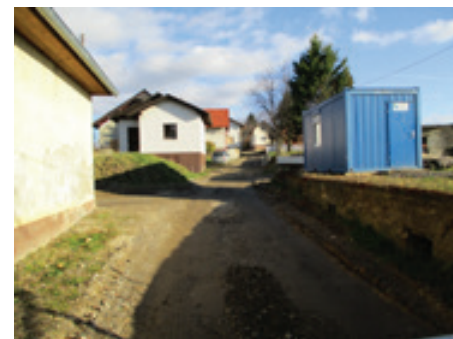
Izgradnja kanalizacije Jastrebc