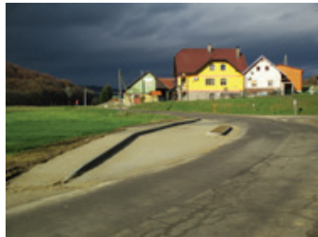
Avtobusna postaja Lešnica