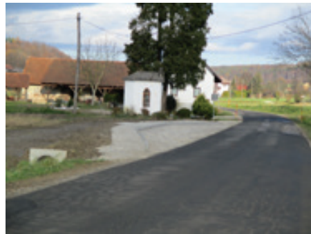
Avtobusna postaja Lešnica