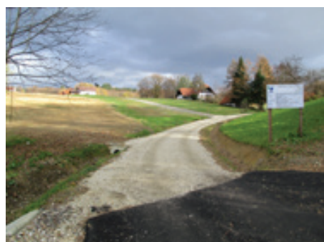
Izgradnja kanalizacije Velika Nedelja