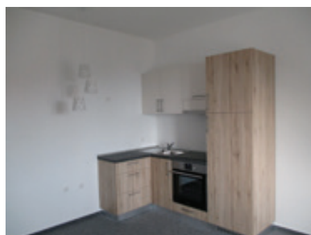
Ureditev prostorov-šola Hum