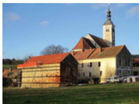
Prekritje strehe Golenkovina-Miklavž