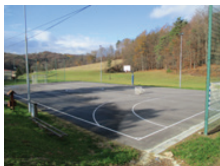
Preplastitev igrišča v Podgorcih