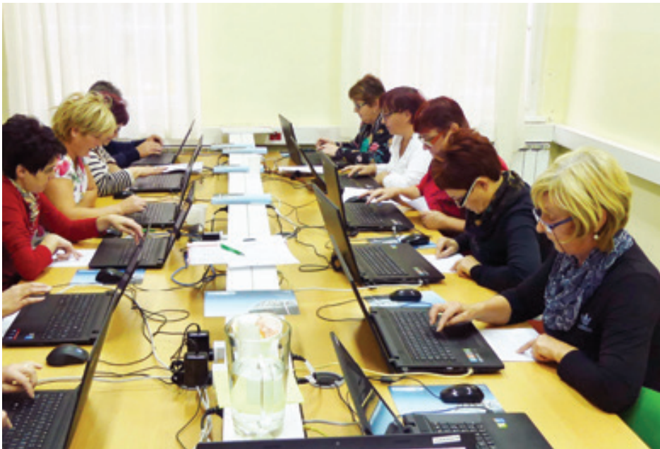
Tekst in foto: Ljudska univerza Ormož

Ste sili tega, da morate vedno znova prositi otroke, naj vam uredijo stvari na računalniku namesto vas? Da nimajo nikoli časa in potrpljenja, da bi vam pokazali, kako naj to naredite sami? Ali želite enkrat priti tej čudni škatli do dna, spoznati njene skrivnosti in si jo za vedno podrediti? Potem se takoj prijavite na brezplačni tečaj računalništva, ki ga za vas organiziramo na Ljudski univerzi Ormož.