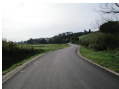
Širitev LC Ivanjkovci-Lahonci