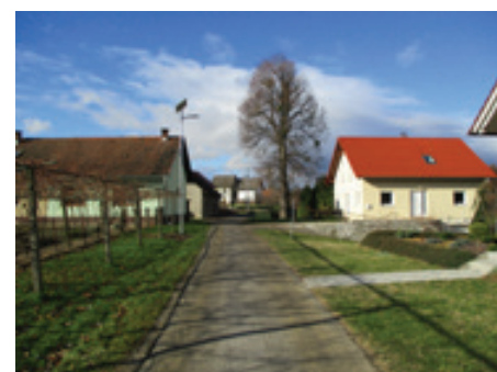
Javna razsvetjava Dobra