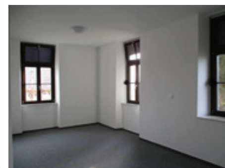
Ureditev prostorov-šola Hum