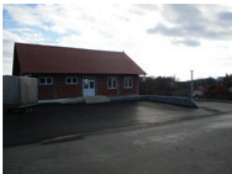
Gradnja GD Hermanci