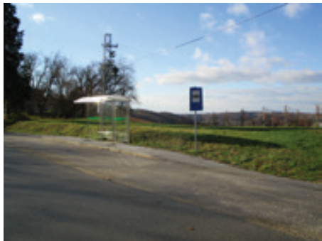
Avtobusna postaja Kog