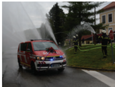
Gasilsko vozilo PGD Podgorci