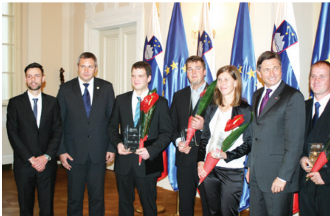
Na podelitvi s predsednikom države Borutom Pahorjem v kristalni palači