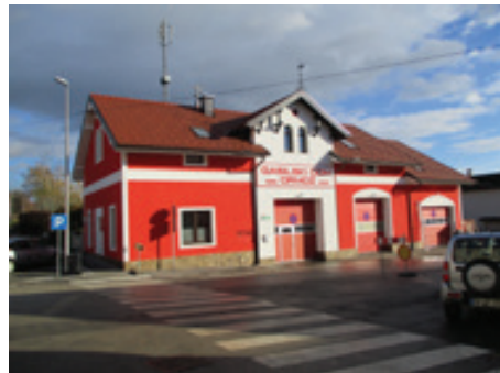
Obnova fasade GD Ormož