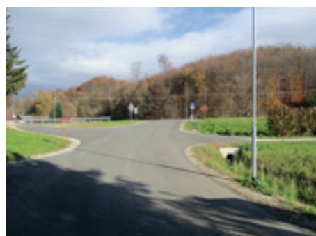
Križišče Mihovci Otok