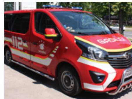
Gasilsko vozilo PGD Senešci