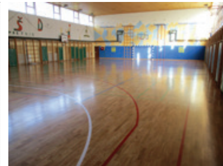
OŠ Miklavž - parket