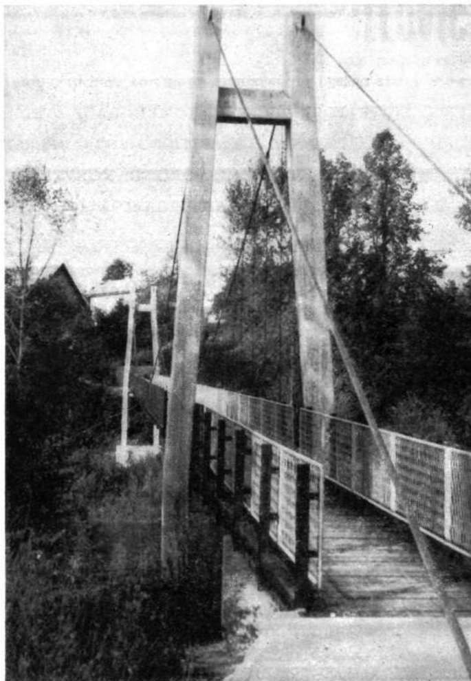
Viseča brv čez Soro pod Ladjo pri Medvodah, ki jo je zgradilo SGP TEHNIK jeseni 1971

gradi in projektira vse vrste gradbenih objektov visokih in nizkih gradenj ter s svojo enoto Komunalne službe oskrbuje škofjeloško območje s pitno vodo