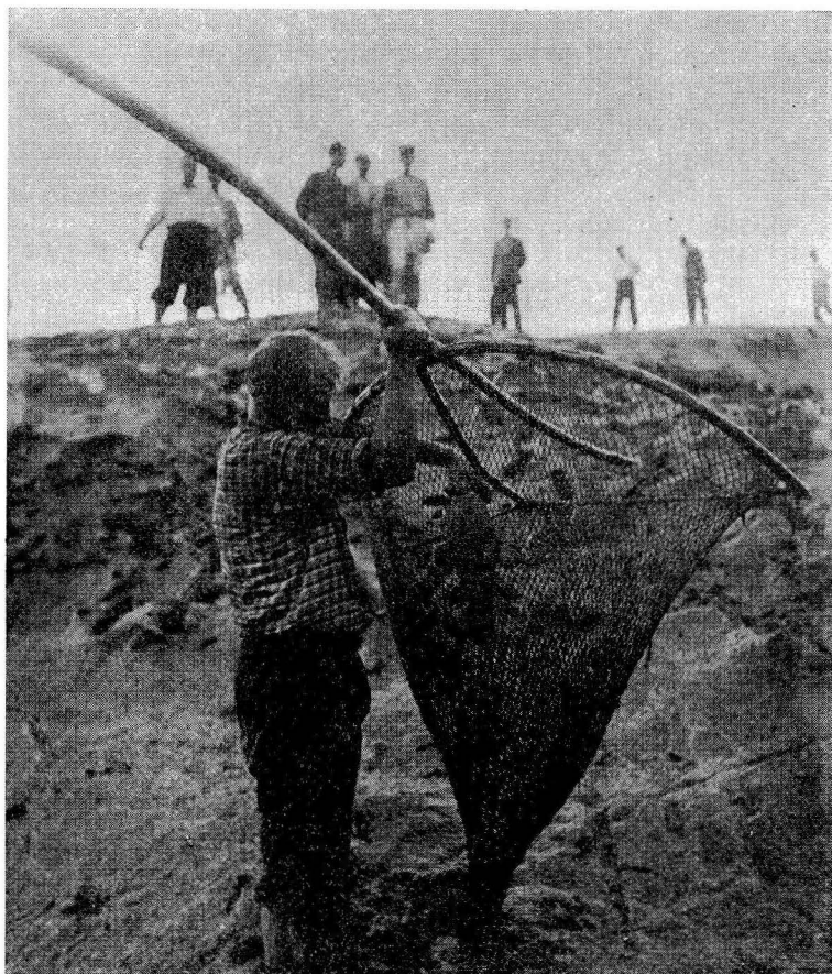
Sl. 1. Reševanje rib ob presihanju Cerknškega jezera

Analize vsebine želodcev in črevesja rib smo izvršili na 465 primerkih različnih vrst rib. Kjer je stopnja prebave dopuščala, smo izvršili determinacijo