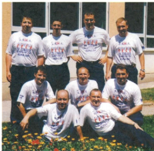
A desetina na tekmovanju GERES v Hrastniku

Med najbolj pomembna tekmovanja spadata tekmovanje občinske gasilske zveze Velenje in tekmovanje gasilskih