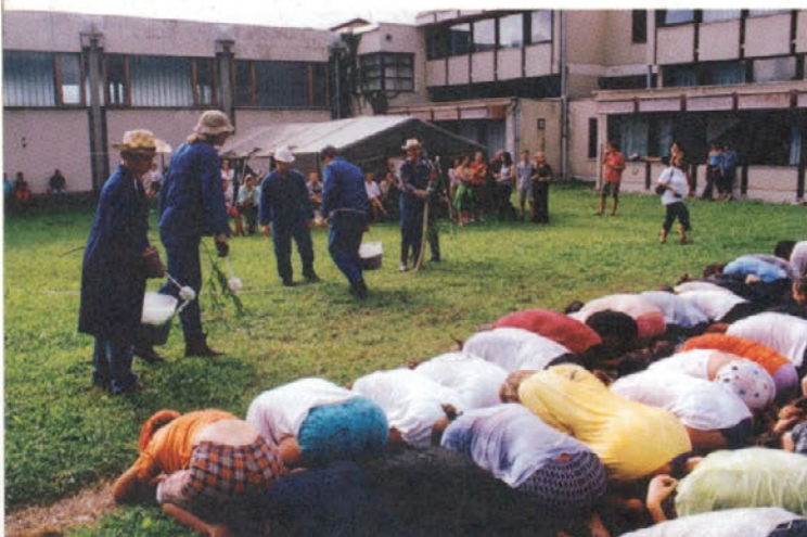
Obvezen in moker del programa: krst novincev.

V letu 2003 se mladinski raziskovalni tabor, 15. po vrsti, vrača v mestno občino Velenje. Dobrodošli mladi raziskovalci v Šentilju! /dj/