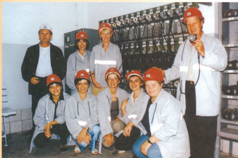
Osem članov delovnega tima Izobraževalnega centra Krka si je ogledalo še Muzej premogovništva Slovenije.