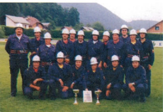
A in B desetini na tekmovanju v Šmartnem ob Paki

Na seji so pregledali tudi prihodnje akcije Rdečega križa. V letu 2003 bo Rdeči križ Slovenije praznoval 50-letnico. Ta jubilej bomo zaznamovali tudi v mestni občini Velenje, v praznovanje pa se bodo vključili tudi Območno združenje in osnovne organizacije RK v podjetjih. /po zapisniku DJ/