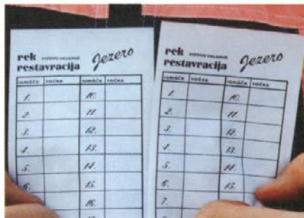
Obrazci iz “davnih časov”...

pijačo, pa seveda majico ŠD, brez katere na takih srečanjih skoraj ne gre več. Tekmovalci iz obrata Preloge pa so bili še dodatno nagrajeni, saj so kot najboljša ekipa dobili v svoje roke prehodni pokal ŠD Premogovnik Velenje. Z njim se bodo lahko “hvalili”