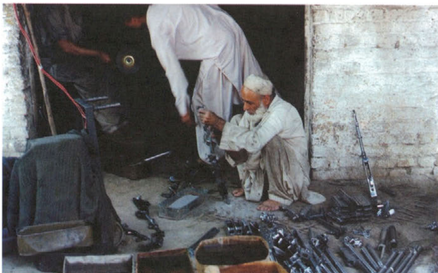
Mojsi so izjemno spretni oblikovalci smrtonosnega orožja.