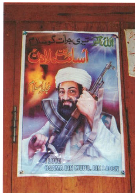
Slika, fotografirana septembra 2000, je 11. septembra 2001 postala resničnost..

Med križarjenjem po Pakistanu smo se ustavili v pet milijonskem mestu Peshawar, kjer smo si uredili potrebne dovolilnice in dobili vojaka za varnost. S taksijem smo se odpeljali na mejni prehod Khyep Pass na meji med Pakistanom in Afganistanom. Pot se je vlekla kot jara kača, saj so nas na številnih kontrolnih točkah neprenehoma ustavljali, tako da smo na mejo prispeli šele po nekaj urah cizazenja. Od tod se je razprl vabljiv pogled na afganistansko mesto Jajalabad.