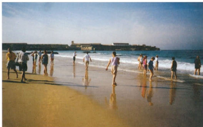
Vročekrvni kopalci, ki so se odločili, da preizkusijo Atlantik, res niso zaznali pravega juga.