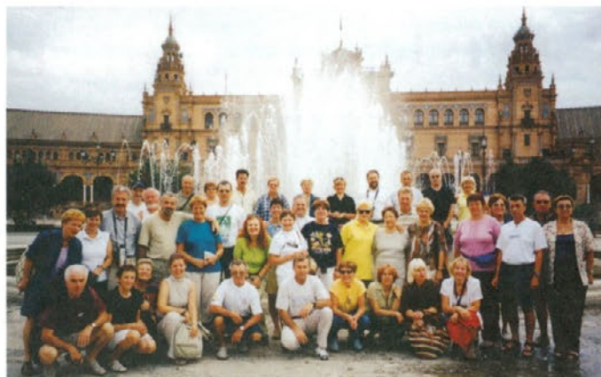
Obiskali smo vzhodni in južni del Španije s pokrajinami: Katalonijo, Valencio, Murcijo in Andaluzijo.

Ob cesti že od daleč zagledaš španskega torota, nepogrešljiv simbol koride. Še toliko prizadevanj združenj proti mučenju živali za opustitev biko-borb ne more zmanjšati ali prepovedati popularnosti tega športa.