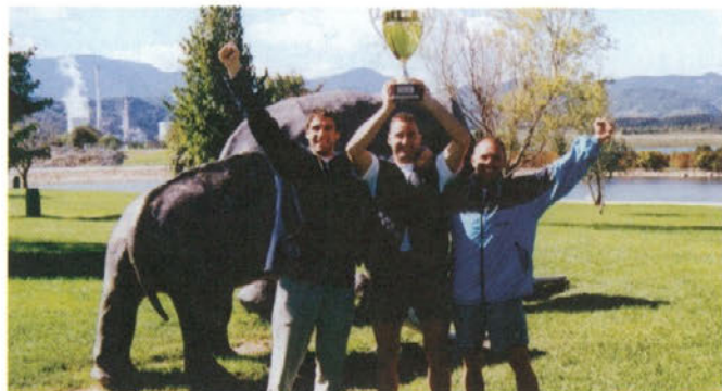
Predstavniki jame Preloge so se uvrstitve na prvo mesto pošteno razveselili in zasluženoma osvojili prehodni pokal 1. športnih iger Premogovnika Velenje.

po Velenjskem jezeru. Jih pa mokro vreme ni motilo. Pet ekip je tekmovalo, med njimi pa so najhitreje in najbolj enotno veslali in uspešno priveslali na 1. mesto tekmovalci obrata Preloge . Drugi so skozi cilj priveslali tekmovalci Mehanizacije in tretji člani ekipe Strokovnih služb.