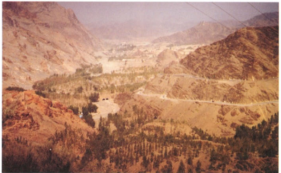
Afganistanska pokrajina, v daljavi mesto Jajalabad.