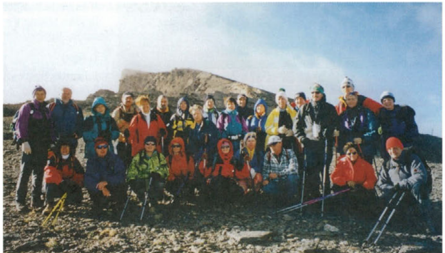
Kar 29 udeležencev se je odločilo spopasti se z drugim najvišjim vrhom Sierre Nevade, Pico de Valeta.

Naslednji dan je bil predviden odhod planincev v Sierro Nevado. Kar 29 udeležencev se je odločilo spopasti se z njenim drugim najvišjim vrhom,