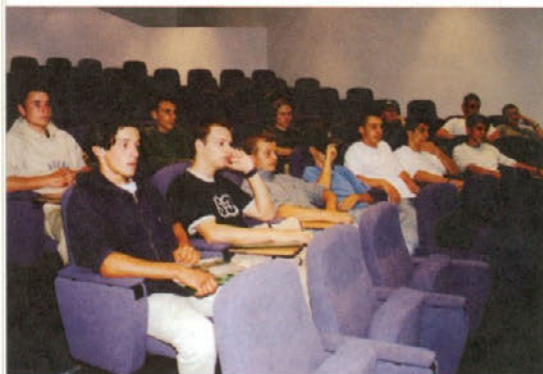
Predavanje s področja ekologije so skladno z izobraževalnim načrtom okoljskega izobraževanja poslušali tudi vsi dijaki, ki pri nas opravljajo praktični pouk – na fotografiji dijaki 1. letnika poklicne rudarske šole.

Na področju okoljskega izobraževanja smo junija nadaljevali z učnimi delavnicami in predavanji v sklopu projekta Vzpostavitev sistema ravnanja z nevarnimi snovmi v Premogovniku Velenje , ki so se jih udeleževali skrbniki za nevarne snovi in skrbniki za okolje Premogovnika Velenje in IP HTZ ter tehnologi, ki nabavljajo nevarne snovi. Predavanja