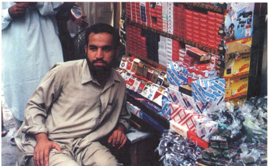
Ponudba je cigaret in hašiša je pestra in obilna.