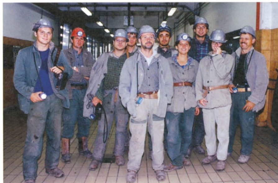
Praksa jim bo pomagala pri nadaljevanju študija, saj so vse, o čemer so se sedaj učili v teoriji, preizkusili in videli v praksi.

podzemnega pridobivanja mineralnih surovin na Hrvaškem ni več, že drugo leto zapored omogočili to prakso.