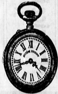
St. 504. Nikelnasta anker-remontoar-Roskopf, trpežno kolesje, gl. 245, enaka iz pravega srebra gl. 395, ista z dvojnatis tršim srebrnim močnim pokrovom gl. 650 in naprej.

Moske ure, 2 tretjini naravne velikosti.