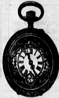
St. 505. Prava srebrna cilindar-remontoar, trpežno kolesje in močni pokrovi, gl. 485, ista z dobrim ankerkolesjem gl. 595 in naprej.