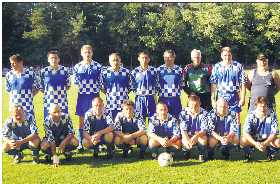
Veterani Hajdine so postali zmagovalci veteranske lige MNZ Ptuj.