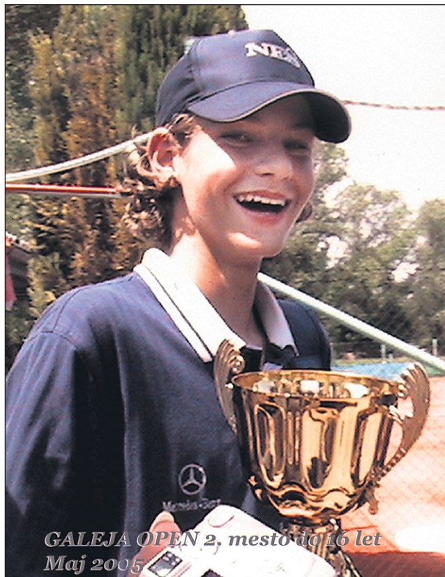
GALEJA OPEN 2, mesto do 16 let Maj 2005