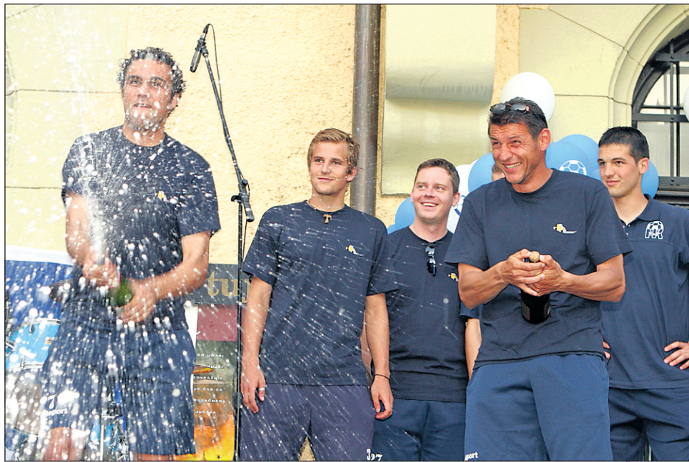
Člani prve ekipe Drave so prinesli male šampanjce, ptujski župan velikega.