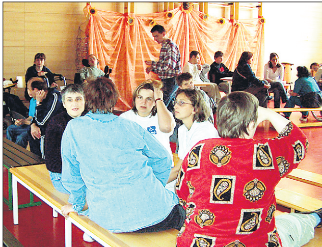
Po festivalu, na katerem so svoje dosežke predstavili varovanci Zavoda in vsi ostali vključeni v projekt, je sledilo prijetno in zabavno druženje nastopajočih.

Ta festival je po prepričanju Gorupove izjemno pomemben zato, ker kaže in dokazuje, da so tovrstni projekti v smeri povezovanja in vključevanja oz. integracije edina prava pot: »To je dokaz, da smo si bolj podobni kot pa različni. Drugo, kar je pomembno, pa je to, da so vsi projekti izkazali kot absolut-