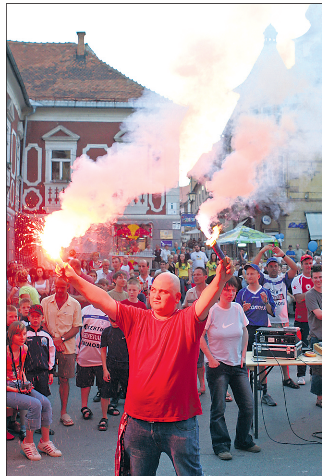
Navijači so ob koncu letošnje tekmovalne sezone prižgali bakle.