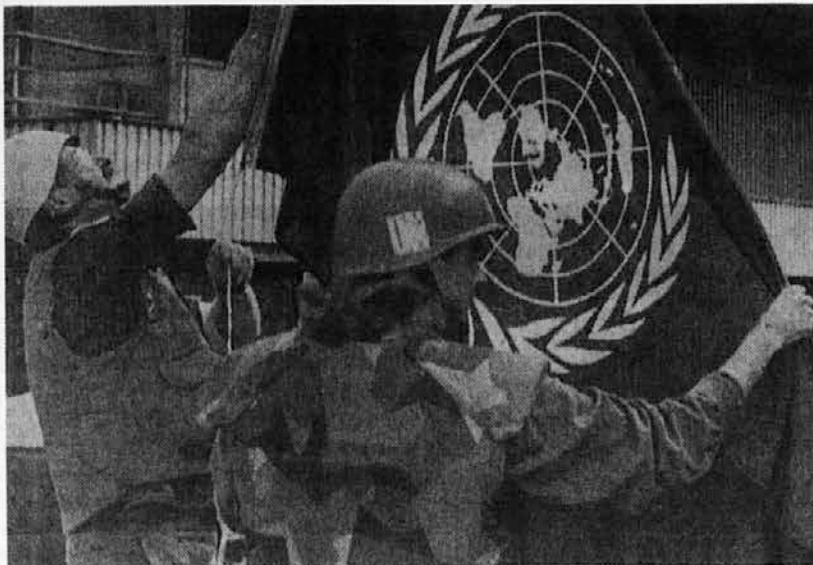
Vojaki dvigajo zastavo OZN na sarajevskem letališču

Varnostni svet je z odobritvijo nove resolucije v ponedeljek,