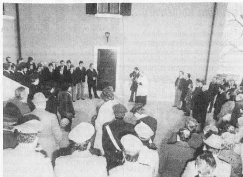
Posnetek s slovesnosti ob odprtju srenjske hiše v Prebenegu

Med najpomembnejšimi prireditvami, ki jih je organiziralo KD »Jože Rapotec«, je prav gotovo proslava - recital ob 35-letnici ustrelitve petih prebeneških kurirk. Leta 1980 je društvo tudi dobilo svoj sedež — obnovljeno srenjsko hišo. Društvena dejavnost je tako polno zaživela. V dvorani srenjske hiše je bilo od tedaj dalje veliko zanimivih in prijetnih tako kulturnih kot družabnih večerov. Bilo je več celovečernih koncertov raznih zborov, nastopov gledaliških skupin, razstav, večerov diapozitivov, proslav. Med rednimi