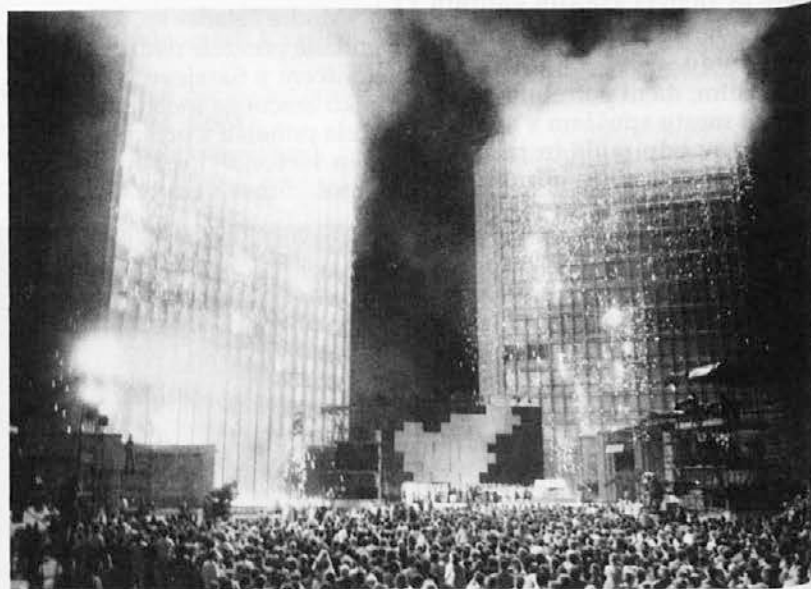
Na Trgu republike v Ljubljani je bilo v sredo, 24. junija, ob praznovanju prve obletnice proglasitve samostojnosti Republike Slovenije vzdušje nadvse slavnostno, a bolj umirjeno in manj evforično kot leto dni prej. Veselje ob praznovanju je skalila gospodarska kriza in vojna, ki se na Hrvaškem in v Bosni še ni zaključila. O tem je govoril tudi predsednik Slovenije Milan Kučan v svojem slavnostnem govoru. Predsednik ni obujal spominov na preteklost, govoril je o bodočnosti Slovenije, o možnostih za njen razvoj in uspeh, ki je že v enem letu svojega samostojnega življenja veliko naredila. Na sliki: »pravljični« zaključek slavlja na Trgu republike v Ljubljani

Slovenija je v zadnjih časih dokazala, da ima velik gospodarski potencial in razvit podjetniški čut, saj je v zadnjem letu nastalo preko 16 tisoč novih malih in srednjih podjetij, v velikem razmahu pa je predvsem obrtništvo. V Sloveniji deluje že 28 bank, velike uspehe pa beležijo tudi t.i. menadžerske šole, kot je npr. mednarodno priznani izobraževalni center v Brdu pri Kranju (International Executive Development Center), ki je v zadnjih šestih letih strokovno pripravil nad 9000 managerjev. Omeniti velja tudi pred kratkim ustanovljeni World Trade Center v Ljubljani, ki je eden izmed 240 tovrstnih svetovnih gospodarskih centrov. Gre za ustanove, ki v 69 državah nudijo svojim včlanjenim podjetjem vsakovrstno strokovno pomoč, tako da npr. že preko 200 tisoč podjetij po vsem svetu lahko v vsakem trenutku izkoristijo elektronski center, preko katerega na podlagi ponudb in povpraševanj lahko sklepajo med seboj kupčije in vsakovrstne gospodarske posle; v Ljubljani se tega Centra poslužuje 140 slovenskih podjetij, njihovo število pa bo po vsej verjetnosti v zelo kratkem času naglo naraslo. Prihodnje leto bo imel ljubljanski Center svoj sedež v popolnoma novem 16-nadstropnem nebotičniku, zraven pa bodo zgradili tudi nov »poslovni« hotel.