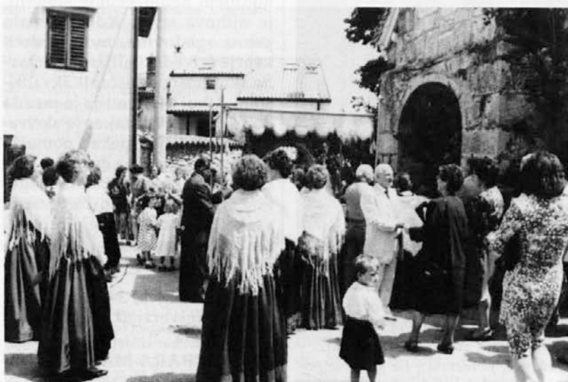
Kot vsako leto so v Križu tudi v nedeljo, 28. t.m., počastili vaška zavetnika sv. Petra in Pavla s procesijo. Igrali so godbeniki iz Nabrežine, videti pa je bilo tudi veliko narodnih noš

naš bančni sistem važen dejavnik specializirane ponudbe v bančnem sistemu Furlanije Julijske krajine, ki je nezanemarljiv celo v