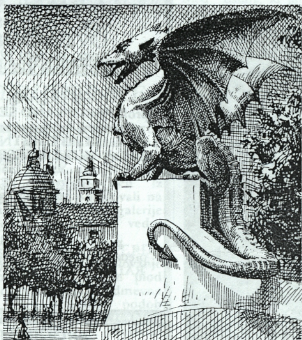
77 Navzlic pomanjkanju je KID 1921.

leta predvidela 2.152.416,87 kron za nedovršene stavbe in industrijsko opremo. Družba je iskala nova tržišča doma in na tujem. V glavnem mestu Slovenije, v Ljubljani, je bil 1921. leta prvi velesejem, ki se ga je udeležila tudi železarna. To je bila lepa priložnost, da se KID uveljavi v Jugoslaviji kot največja železarska industrija, s svojimi povojnimi izdelki. Po vsem svetu poznane zrcalovine in feromangana ni mogla več razstavljeni kot nekoč, pač pa le jeklarske in livarske izdelke. Med obiskovalci ljubljanskega velesejma je bilo največ zanimanja za lepo okrašene zvonove. Jeseniški kovinarji so tokrat ponovno dokazali, kaj zmorejo.