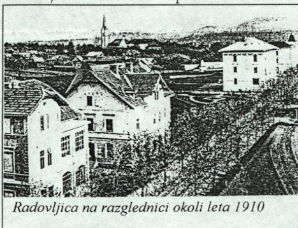
Radovljica na razglednici okoli leta 1910

»Radovljiška ravnina - Dežela je stara kulturna pokrajina. O neprekinjenem kulturnem razvoju in poseljenosti radovljiškega prostora lahko govorimo vsaj od bronaste dobe dalje, najnovjša arheološka odkritja pa pomikajo časovno mejo stalne naselitve se globje v prazgodovino. Radovljiška ravnina je bila vseskozi kmetijska pokrajina in kot taka se kaže tudi v franciscejskih katastrskih operatih in