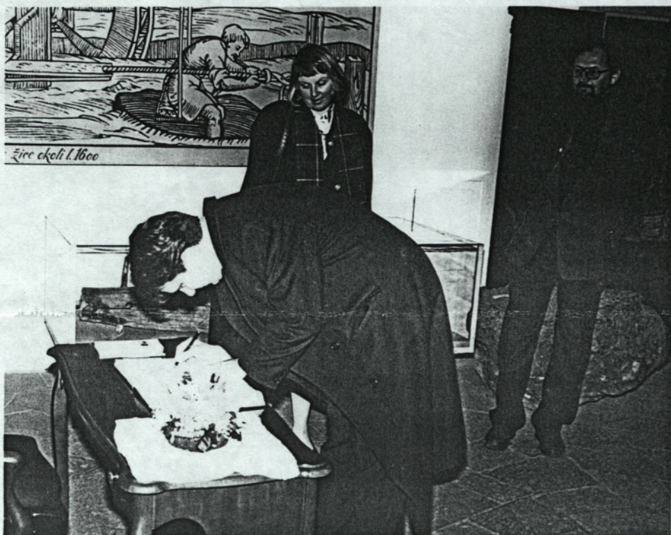
2. marca 1998 je Muzej Jesenice obiskal minister za kulturo RS JOŽEF ŠKOLČ. Med drugim si je ogledal dela na trenutno največji kulturni investiciji »kasarni«. Po ogledu železarske zbirke se je vpisal v vpisno knjigo.