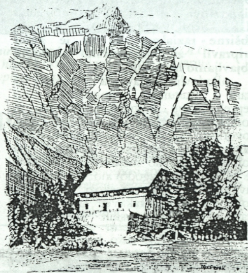
Aljažev dom v Vratih

Zahvaljujoč velikemu posluhu in razumevanju občine Kranjska Gora, je bila v preteklem letu opravljena inventarizacija gradiva, razstavljenega in hranjenega v prostorih Triglavske muzejske zbirke v Mojstrani. Le-ta naj bi bila osnova, na kateri se bo gradil bodoči muzej.