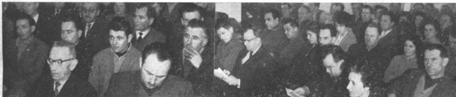
Delegati in gosti na občinski konferenci SZDL med branjem referata o bodočih nalogah SZDL v občini Lenart

gre za to, da smo pri tem sentimentalni, da mislimo, da sedaj to kar je moje ne bo več moje itd. Tu je osnovno vprašanje ali bo isti človek, ki je sedaj privatni kmet jutri živel boljše, če bo zemljo prodal. To je potrebno upoštevati, kadar govorimo, da revolucija prinaša žrtve. Jaz smatram, da je žrtev to, če se mora človek odpovedati roki, glavi, nogi, če je lačen, raztrgan itd. Če pa pravimo, in to je tudi dokazano, da družbeni sektor daje trikrat ali petkrat več kot pa privatni sektor v katerem se sedaj marsikak kmet muči, to pomeni, da ustvarjamo večjo družbeno bogastvo. Individualno gospodarjenje izgublja kot pojem gospodarjenja, ampak se lahko smatra bolj kot pojem životarjenja. Potrebno je vlagati skupne napore, da bomo družbeno osnovo dvignili na višjo raven. Ko bomo ustvarili močnejšo osnovo ne bo vprašanja, da bi slabše živeli, ampak, da bomo živeli temu primerno tudi boljše. Večja bodo ustvarjalna sredstva, več šol bomo lahko gradili, več zdravstvenih postaj, več cest itd. Revolucija naj bo v kmetijstvu taka, da bo ustvarila več sredstev in da bo zato človek boljše živel.