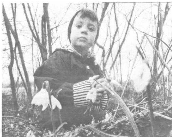
V deželo prihaja pomlad, njeni prvi znanilci pa so bili letos kar malo zgodnji!