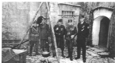
Na sliki: Vojaške uniforme skozi čas

ogrsko vojske ter italijanske vojske, so zbiralci, ki ohranjajo kulturno dediščino in zgodovino Slovencev, ki so se borili na Soški fronti. Tudi sam sem z udeležbo v