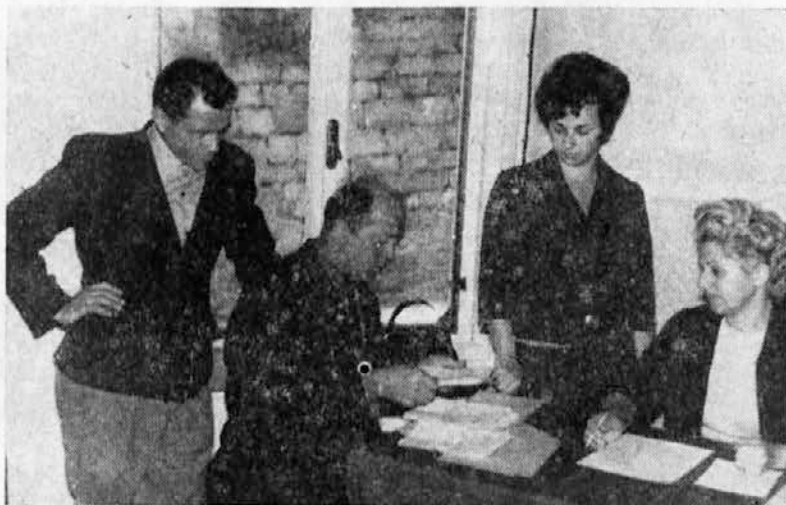
Ugotavljanje rezultatov na volišču upravnih služb