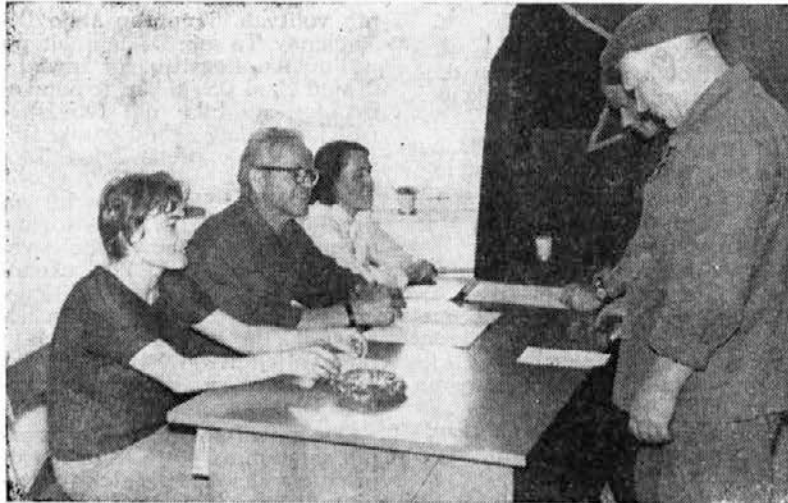
Volišče v oddelku hranil v prahu