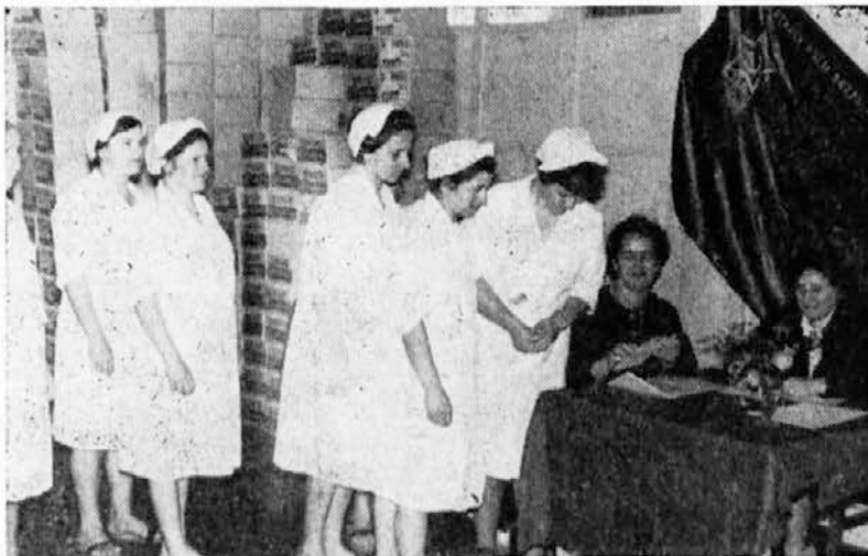
Volišče v oddelku gotovih juh

Na tej seji, ki je bila 18. junija 1966, so bili verificirani mandati 25 članom DS in dvema članoma, izvoljenima na nadomest-