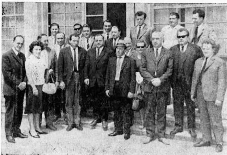
Poklicni tovariši iz Avstrije med predstavniki Delamarisa