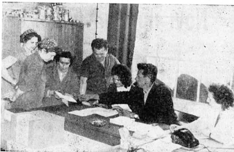
Volišče v litografiji