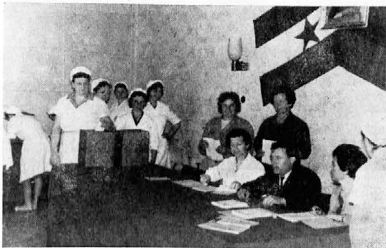
Oddelek predelave rib je glasoval v Rdečem kotičku

»NAS GLAS« izdaja kolektiv konzervne industrije »DELMARIS« Izola — List urejuje uredniški odbor. — Odgovorni urednik AVUGUST BREZAVŠČEK — Tiska tiskarna ČZP Primorski tisk v Kopru.