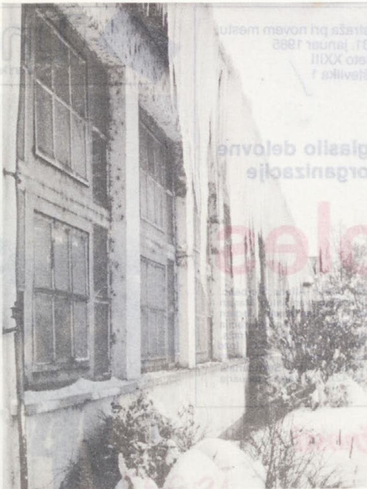
Huda zima ni prizanesla niti Novolesu