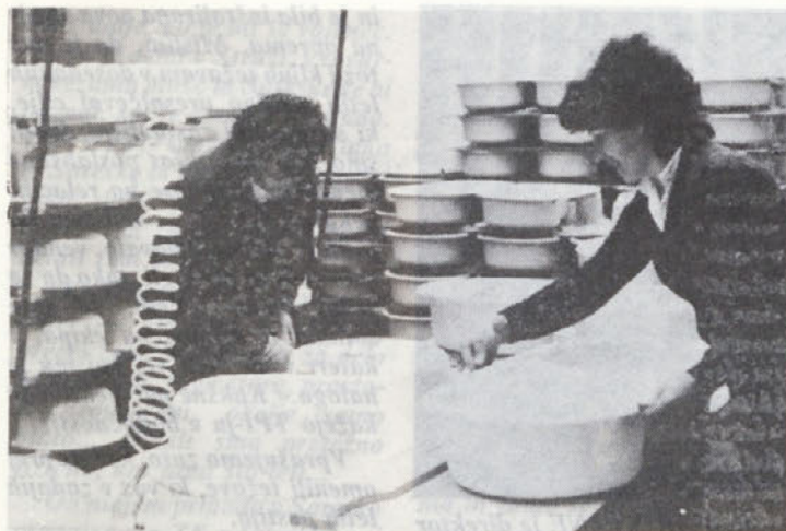
Proizvodnja kuhinjskih korit v Radatoviču