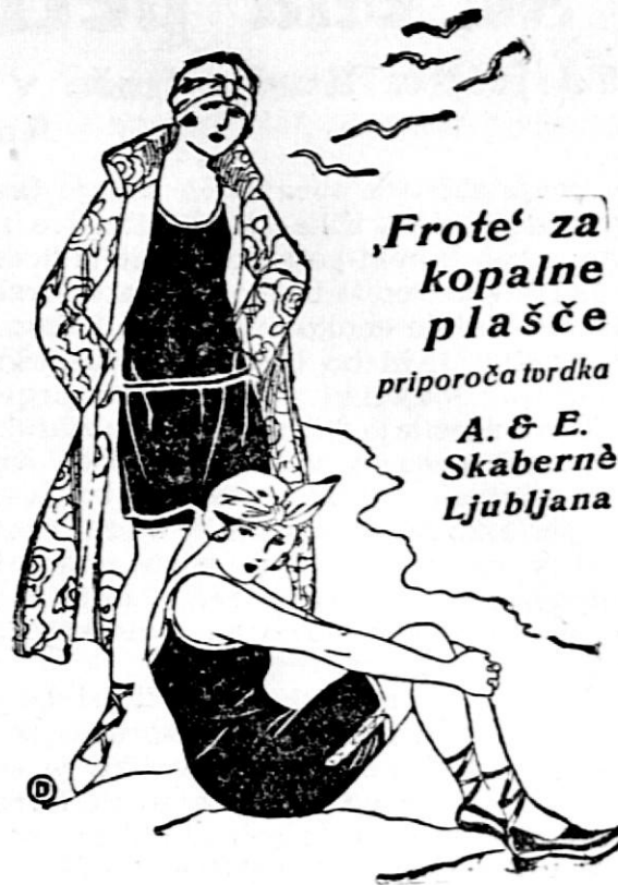
'Frote' za kopalne plašče priporoča turdka A. & E. Skaberné Ljubljana

Na cvetličnem vrtu nadomestimo odcvetujoče pomladne rastline s poletnimi. Na rabatah posadi nižje spredaj, višje zadaj. Na skupinah na prostem pa postavi v sredo večje, proti robu dajdalje manjše. Vrtnice so v polnem cvetju. Čim odcvetevajo posamezni cveti, odreži jih nižje spodaj nad prvim razvitim popkom. S tem pospešiš ponovno cvetenje. Daljše poveži h kolom, da ne položajo in da se ne pomnijo. Ker so noči toplejše, zalivaj lončnice zvečer s toplo vodo. Ako jih po enkrat na teden zaliješ z razredčeno gnojnico ali s lahko raztopino umetnih gnojil, podpreš rast in cvet. Ako zasetaj voda v kakem lončiku, presadi cvetico nemudoma, da ne zboli in usahne.