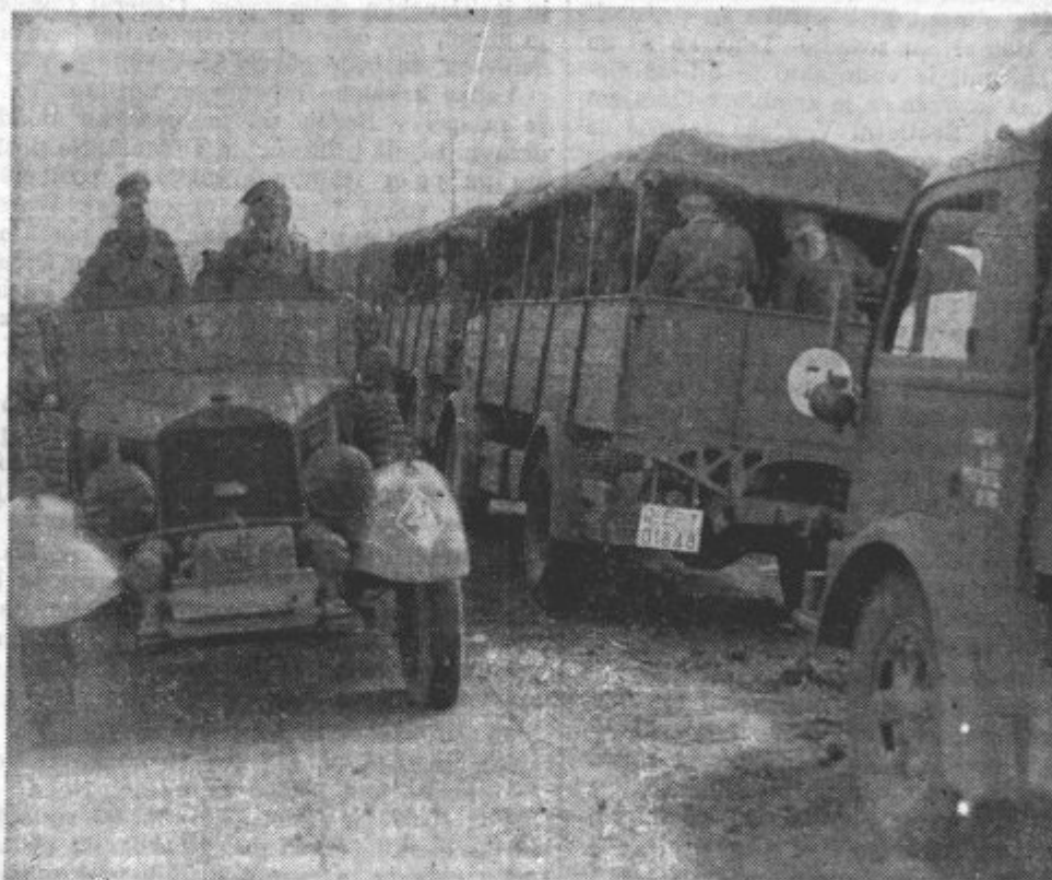
Duce in Hitler srečujeta na svojem obisku vzhodnega bojišča italijanske motorizirane kolone

* Prepovedana raba fižolove moke. Po odredbi kmetijskega ministrstva je prepovedana raba moke iz fižola, leče in graha v slaščičarstvu. Ostanke take moke, ki so jo še imeli slaščičarji na zalogi, so se morali porabiti do 5. septembra.