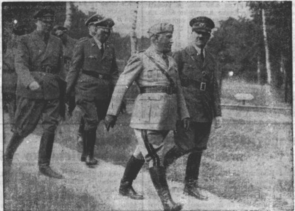
Duce in Hitler na vzhodnem bojišču

plačnega pregleda in zdravljenja. Se več pa je bilo pregledano v popoldanskih urah, tako da so imeli zdravniki in sestre pomočnice dovolj posla v vseh oddelkih. Po približnih ugotovit-