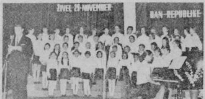
Posnetek s proslave med govorom A. Zagarja.

podpredsednik SO Ptuj. U- vodoma je dejal, da je šest- indvajset let preteklo od zgo- je (Konec na 2. strani)