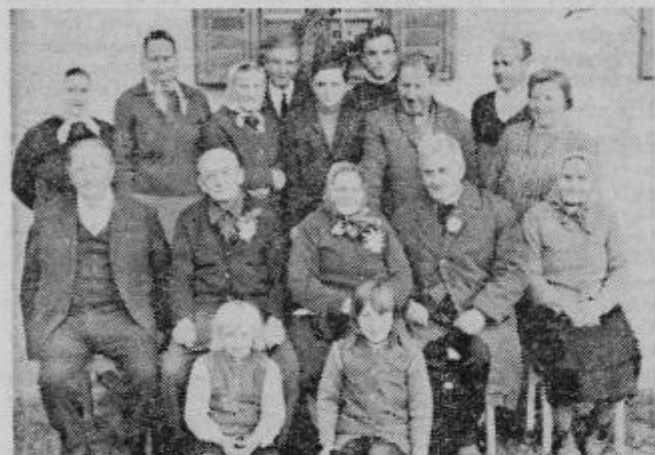
Udeleženci družinskega slavlja pri »Puhovih« v Sakušaku