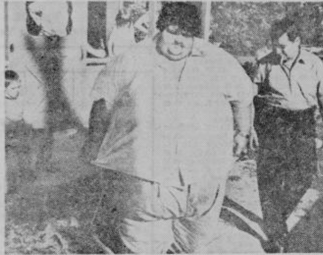
Ljudje normalne teže smo v primerjavi z njim prave muhe