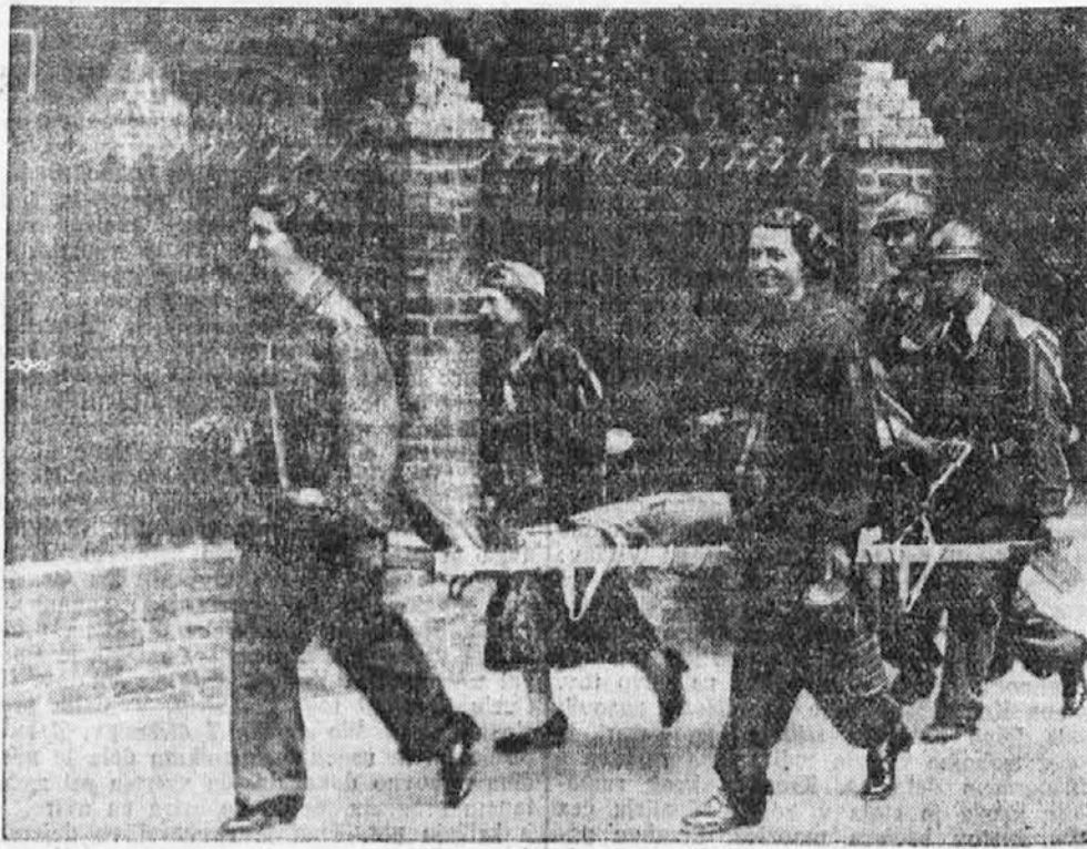
Tudi Belgijci hočejo biti na vse pripravljene! Pred nedavnim so v Bruslju priredili letalski napad in portiletalsko obrambo civilnega prebivalstva. Takrat ste videli po ulicah vse polno prizorov, kakršnega predstavlja naša podoba.