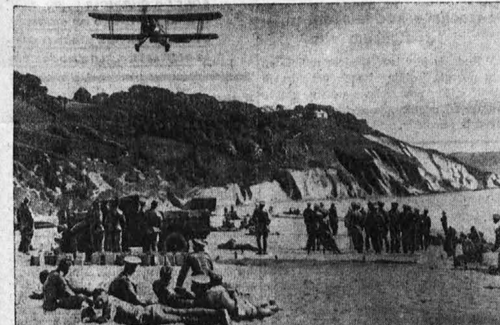
Vojaške vežbe angleške vojske. Pred nedavnim je imela 9. pehotna brigada na južni obali Anlije volike vojaške vežbe, pri katerih so sodelovala tudi letala in pa motorizirani oddelki vojske.