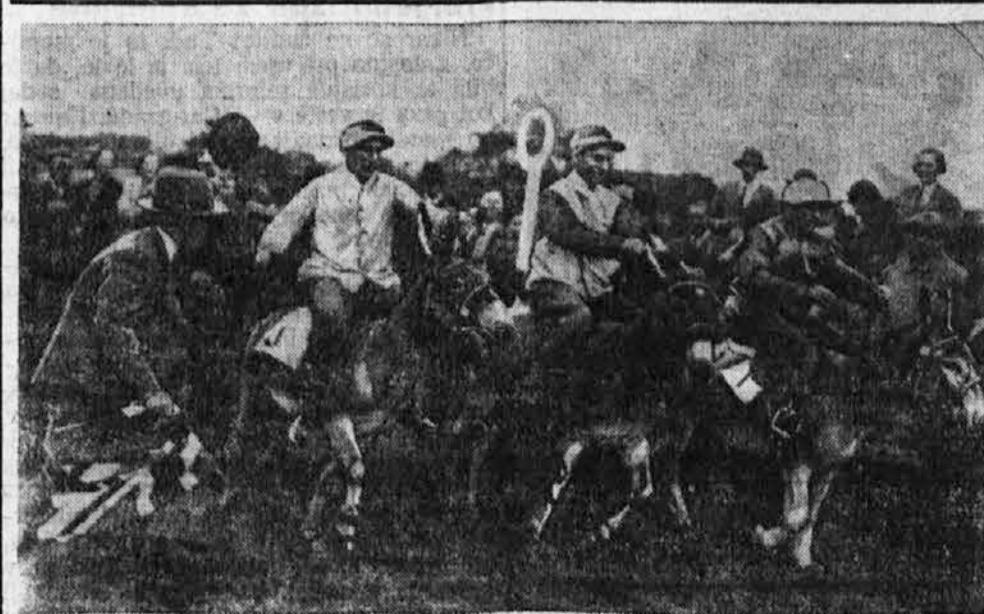
Oslvska tekma. V Marlboroughu na Angleškem so pred nedavnim priredili pravcato dirko na oslih. Dirka je vzbujala mnogo smeha in dobre volje med gledalci

V Kodanju je v tamkajšnjem zoološkem vrtu povrgla levinja »Bella« pet zdravih mladičev. Ker povrže levinja po navadi le dva do tri mladiče, je kodanjska levinja pravcata senzacija.