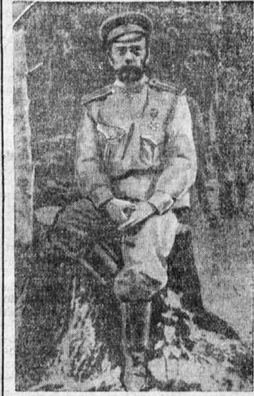
SKRBI ZA »EDINOST«!

Nikar se ne čudite! Tudi to je mogoče. Zalostno pri vsem tem je le to, da je bila ta koristna reforma uvedena sedaj kot prva te vrste v — Carigradu. Kolesar bo moral pokazati pred izpitno komisijo, da-li je tolikanj siguren, da si more tudi v največjem prometnem metežu rešiti svojo kožo s tehniko svoje vožnje. Izkazalo se je namreč, da je velik del prometnih nesreč pripisati uprav kolesarjem, ki večinoma ne poznajo disciplino, v mnogih slučajih pa tudi ne razpolagajo s tisto sretnostjo izmikanja in balansiranja, ki je potrebna za količkaj sigurno vožnjo. Bojazljivcev, ki v metežu ustvarjajo paniko, turška policija sploh noče pripustiti v promet.