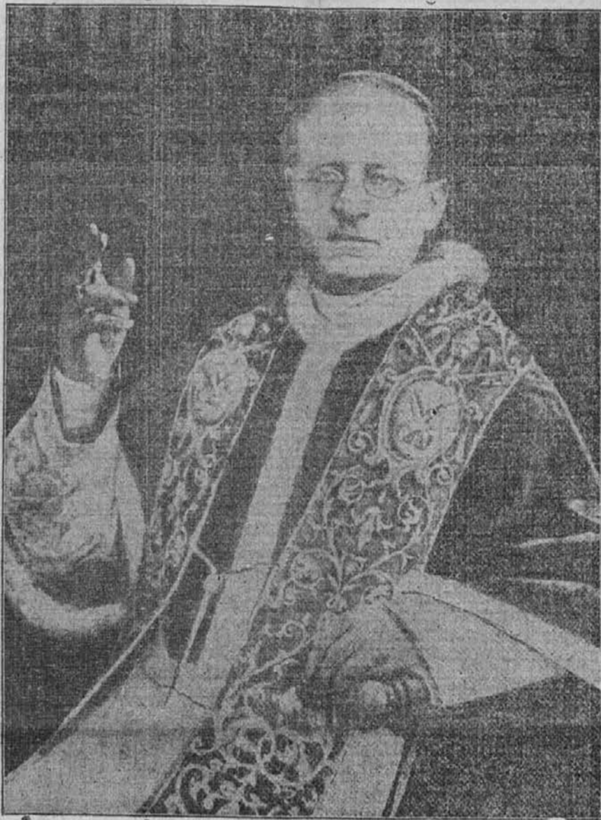
PAPEŽ PIJ XI. VELIK ZAGOVORNIK MIRU IN SOCIALNE PRAVIČNOSTI UMRL V PETEK ZJUTRAJ.

San Francisco, Cal. — Tukajšnje mesto je končalo z zadnjimi pripravami za otvoritev svetovne razstave, ki se bo izvršila prihodnjo soboto, 18. februarja. Za ta dan je guverner proglasil državni praznik za vso Kalifornijo, v mestu San Francisco pa bodo uradne proslave trajale kar