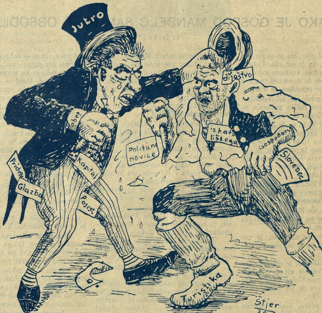
„Jutro“ in „Slovenec“ v polemiki.

Izdajatelj in odgov. urednik Ivan Kavčič v Ljubljani. Tiska Zvezna tiskarna v Celju, za tiskarno odgovarja Milan Četina v Celju.