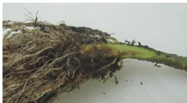
Fusarium oxysporum f.sp. lycopersici