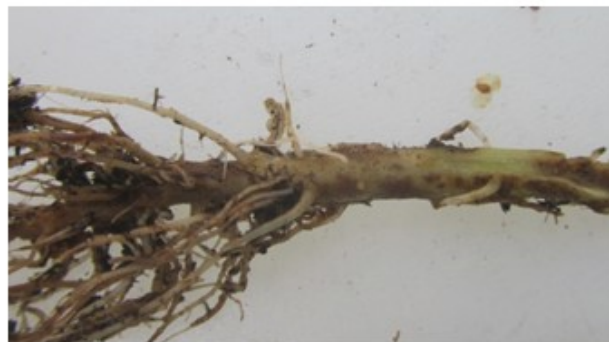
F. oxysporum f.sp. radicis-lycopersici