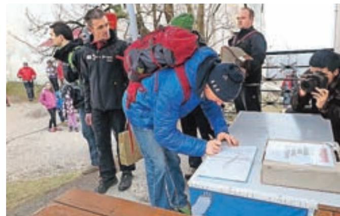
Podpis v knjigo, v kateri se je na koncu dogodka zbralo 1452 podpisov.

ca, bo na Glavnem trgu potekala Tržnica slaščic, kjer bodo za dobrote zbirali prostovoljne prispevke. V nedeljo, 26. marca, pa sledi še dobrodelni turnir v odbojki. Ves marec zbirajo tudi