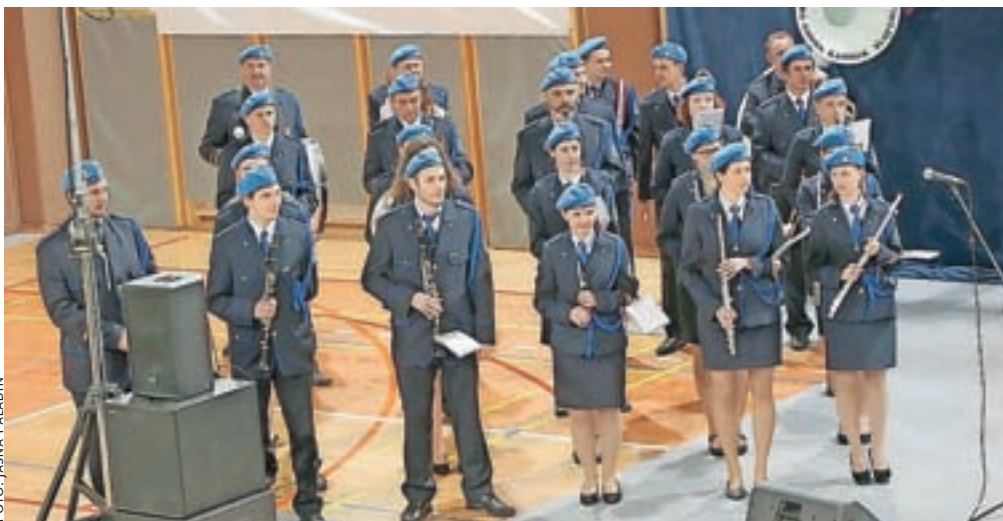
Kot prvi nastopajoči so letos na koncertu zaigrali godbeniki Mestne godbe Kamnik.