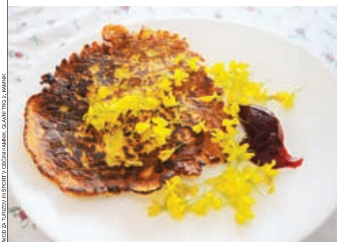
ZAVOD ZA TURIZEM IN ŠPORT V OBČINI KAMNIK, GLAVNI TRG 2, KAMNIK

Recepte že pozabljenih jedi pošljite na naslov TIC Kamnik, Glavni trg 2, 1241 Kamnik, lahko pa jih osebno prinesete vsak dan od 9. do 16. ure. Zraven pripišite kraj in ime gospodinje, ki je po tej recepturi pripravljala lokalno kamniško jed. Vsak recept bo nagrajen s kuhalnico Okusi Kamnika.