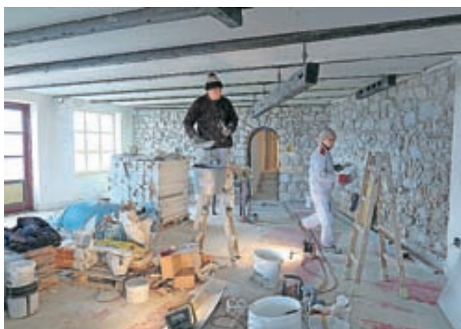
Izbrani izvajalci te dni urejajo notranjost kleti, kjer bodo uredili okrepčevalnico.