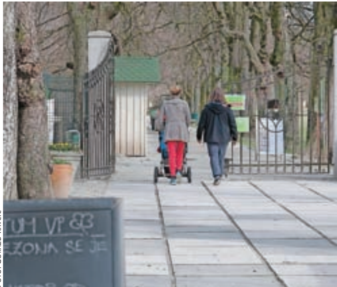
Konec februarja so v Arboretumu znova na široko odprli vrata v svoj park, kjer se narava že prebuja.

»V zadnjem mesecu smo opravili številna dela, saj želimo, da bi naši obiskovalci odhajali iz Arboretuma čim bolj zadovoljni. Narava se počasi prebuja, za zdaj še sramežljivo kukajo na plan telohi in drugi prvi znanilci pomladi. Vsak sončen dan pa prispeva k temu, da se odpre nekaj novih cvetov, ki smo jih željni po sivih zimskih dneh,« sporočajo iz Arboretuma, kjer še vedno gradijo nov vhod v park.