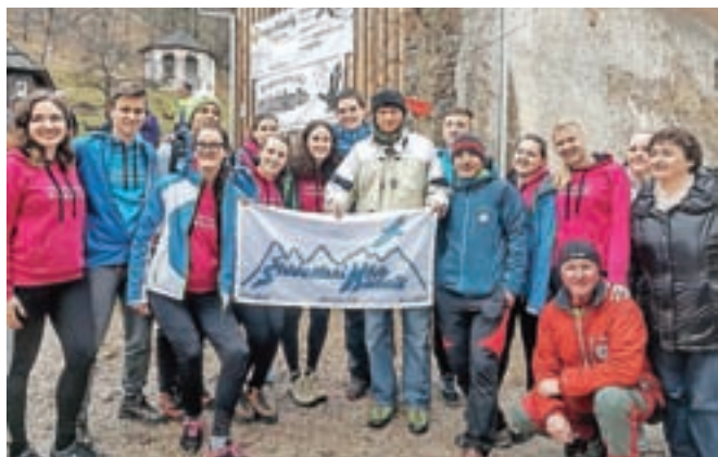
Predsednik republike Borut Pahor skupaj z organizatorji iz Študentskega kluba Kamnik