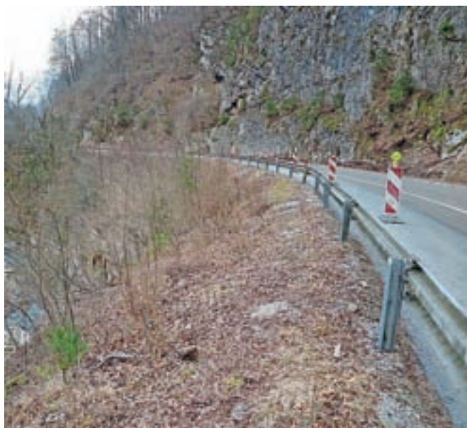
Sanacija poškodovanega odseka naj bi bila zaključena do maja.

znejšo rešitev. Predvidoma bo to nov armaranobetonski podporni zid v sami strugi Kamniške Bistrice v dolžini približno petdeset metrov, kar bo znano, ko bodo geologi zaključili z delom in pripravili končno mnenje. Sanacijo bomo začeli takoj po prejetju končne rešitve. Ker gre za elementarni dogodek, bo sanacijo izvajal pristojni koncesionar. Če bo izbrana navedena rešitev, ocenjujemo, da bi lahko bila sanacija zaključena do maja, odvisno od vremena oz. vodostaja reke,« pojasnjujejo na Direkciji RS za infrastrukturo.