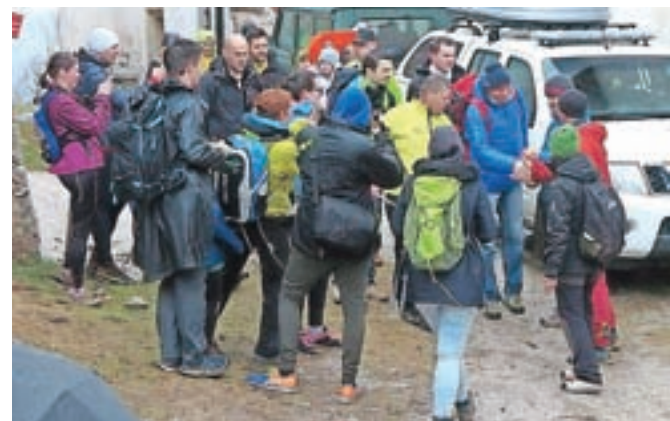
Borut Pahor se je izkazal za zelo sproščena in dostopnega gosta.