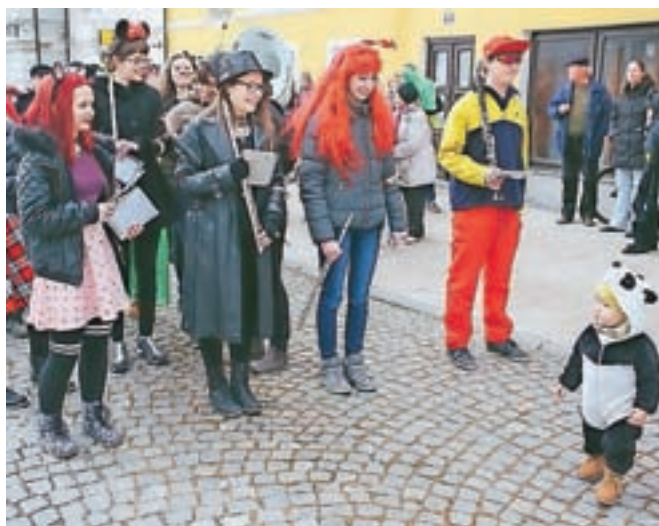
Kamniški karneval se je začel s takti našemljenih godbenikov in mažoret, njim pa so vse do odra na Glavnem trgu sledile pisane maškare vseh starosti.