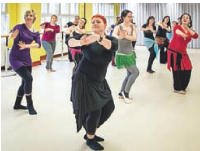
Glavna učiteljica festivala Nesma je imela vse svoje delavnice razprodane.

vanjema ter nastopi izbranih folklor Egipta ter Arabskega polotoka. Sobotni plesni večer je navdušil z gala večerom Nawar, na katerem so zaplesale učiteljice festivala ter povabljene plesalke iz Slovenije ter Evrope. Dvaindvajset plesnih točk je navdušilo zbrano publiko z zanimivo paleto plesnih stilov, čudovitimi koreografijami in barvitimi plesnimi kostumi.