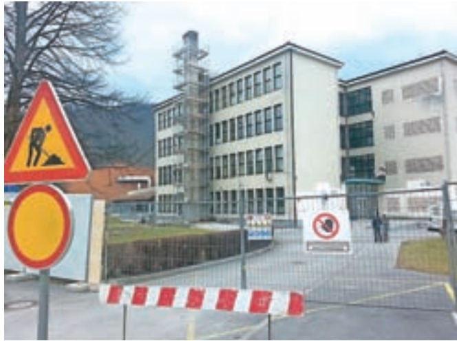
Samostoječega dimnika pri Osnovni šoli Frana Albrehta, ki že nekaj let ni opravljal svoje funkcije, ni več.

Kamnik – Občina Kamnik je prejšnji teden, da zaradi zimskih počitnic pouk na šoli ni bil moten, z izbranim izvajalcem porušila dimnik na Osnovni šoli Frana Albrehta. Samostoječi petindvajset metrov visoki dimnik že nekaj let zaradi uvedbe daljinskega ogrevanja z območja Svilanita ni bil več v funkciji, zaradi dotrajanosti pa se je že začel luščiti omet, zato ga je bilo treba zaradi varnosti učencev, zaposlenih na šoli ter mimoidočih pešcev in kolesarjev porušiti. Zaradi rušitvenih del sta bila ves teden zaprta kolesarska steza in pločnik, dela pa so bila zaključena v roku - v petek, 3. marca J. P.