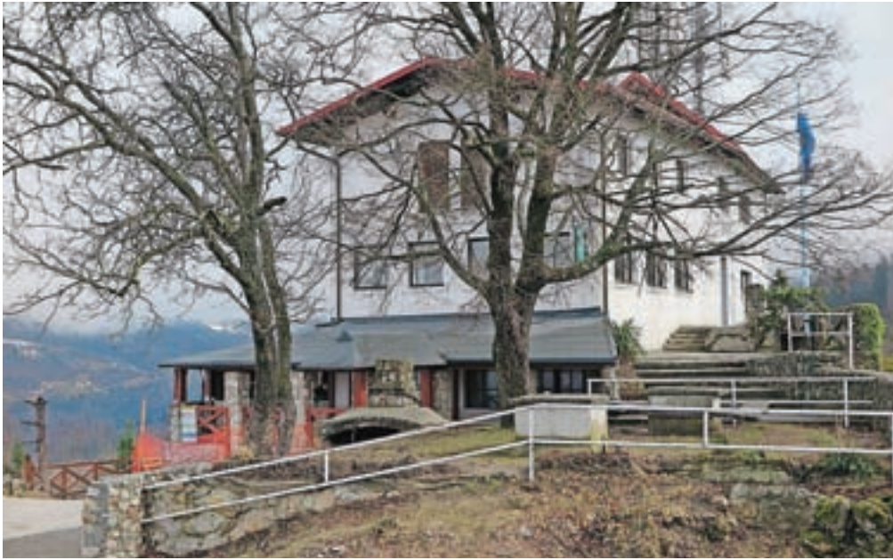
Stari grad naj bi svoja vrata znova odprl že v drugi polovici aprila.

Kamnik – Stari grad, priljubljena izletniška in pohodniška točka nad Kamnikom, kjer je nekdanje delovalo gostišče, se je pred dvema letoma po dolgotrajnem pravdanju z nekdanjima podnajemnikoma v last Občine Kamnik vrnil v precej slabšem stanju, kot je verjetno večina pričakovala. Po udarniški čistilni akciji številnih Kamničanov so se vprašanja na občini – kdaj bo gostišče znova zaživel – kar vrstila, prav tako je upanje po oživitvi te lokacije vzbudila občinska proslava ob prvem maju lanske leto. A gradbena in obnovitvena dela se kar niso začela.