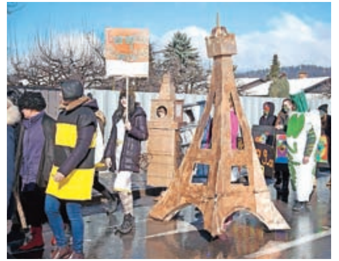
Na Duplico so prišle tudi nekatere evropske znamenitosti – pariški Eifflov stolp, angleški Big Ben ter italijanski poševni stolp iz Pise.