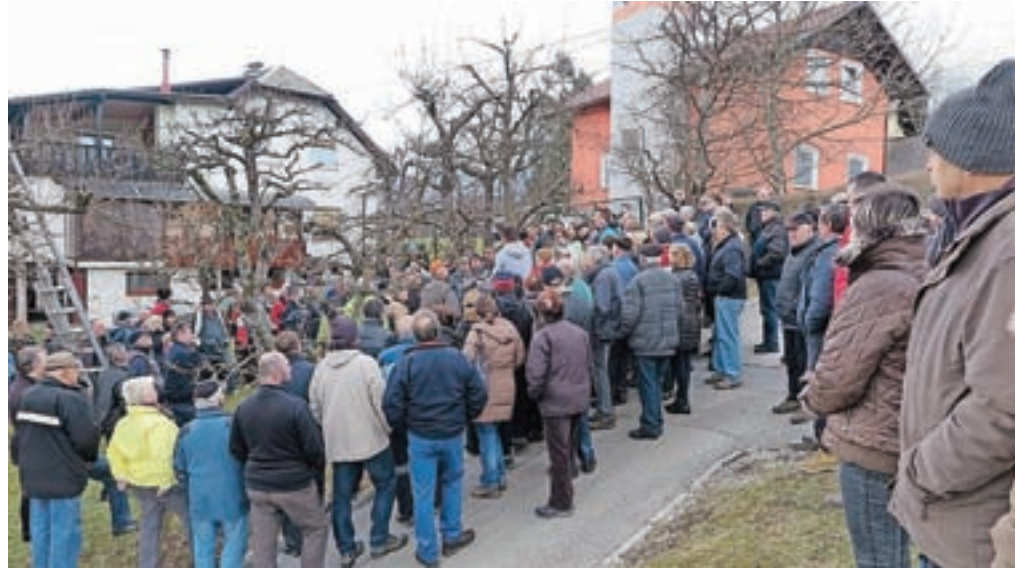
Praktični prikaz obrezovanja sadnega drevja je bil tudi letos dobro obiskan.

Praktični prikazi obrezovanja sadnega drevja so vsako leto zelo dobro obiskani – in letos ni bilo nič drugače. Domačinov že skorajda ni več, med udeleženci pa Valentin Zabavnik opaža sadjarje iz bližnje in tudi daljne okolice. Še posebno zanimivi so ti prikazi postali, odkar nad