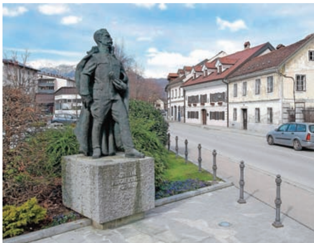
Maistrov spomenik na Trgu talcev

Vrhunec letošnjega praznovanja bo znova na sam dan praznika, 29. marca, ko občina vse občane vabi