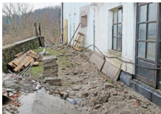
Urediti je treba tudi hidroizolacijo po celotni dolžini severne strani objekta.