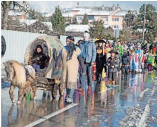
Sprevod maškar je na pustno soboto na Duplici pričakal sneg, a so ga maškare, tako kot se zanje spodobi, hitro stopile.

Pustne šeme so imele tudi letos veliko dela z odganjanjem zime. Kako jim je uspevalo in kako izvirne so bile letos maske, smo preverili na dveh največjih rajanjih v občini – na pustnem sprevodu na Duplici in na Kamniškem karnevalu v središču mesta.