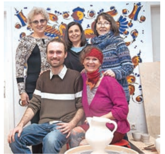
Člani KUD Hiša Keramike, zakaj pa ne majolka

Občinski svet Občine Kamnik podeljuje Kulturno-umetniškemu društvu Hiša keramike, zakaj pa ne majolka bronasto priznanje Občine Kamnik za ohranitev in prenos znanja poslikave v slogu majolike in širjenje kulture, povezane s keramiko.