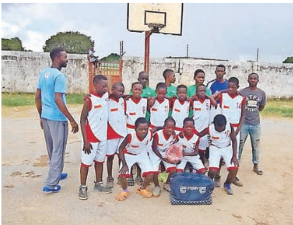
Mladi zambijski košarkarji z opremo, ki so jim jo podarili kamniški vrstniki.

Kamnik – Poleg odličnih iger naših selekcij košarkarji kluba Calcit Basketball dokazujemo, da smo pravi ambasadorji športa tudi na humanitarnem področju. Tako smo se ob koncu leta s pomočjo Slovenskega poslovnega kluba v Zambiji z dobrodelno akcijo odzvali prošnji mladih zambijskih košarkarjev. V zameno za njihov nasmeš jim v njihovo domovino poslali svoje stare športne drese, majice ter nekaj žog. Prav tako bomo tudi v prihodnje organizirali še nekaj podobnih akcij. Ena od prvih bo zbiranje košarkarskih copatov, ki so jih naši igralci že prerasli. S takimi akcijami dokazujemo, da šport ne pozna meja. Veselje otrok ob prejemu prave košarkarske opreme pa je neprecenljivo.