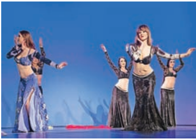
Na kamniškem odru je v soboto zvečer nastopilo več kot šestdeset plesalk orientalskega plesa.

Kamnik – Ljudske pevke Predice v letošnjem letu praznujejo že 15-letnico delovanja. Jubilej bodo praznovale v petek, 24. marca, ob 19. uri v Domu kulture Kamnik s koncertom, ki so ga naslovile Dekle, daj mi rož rdečih. J. P.