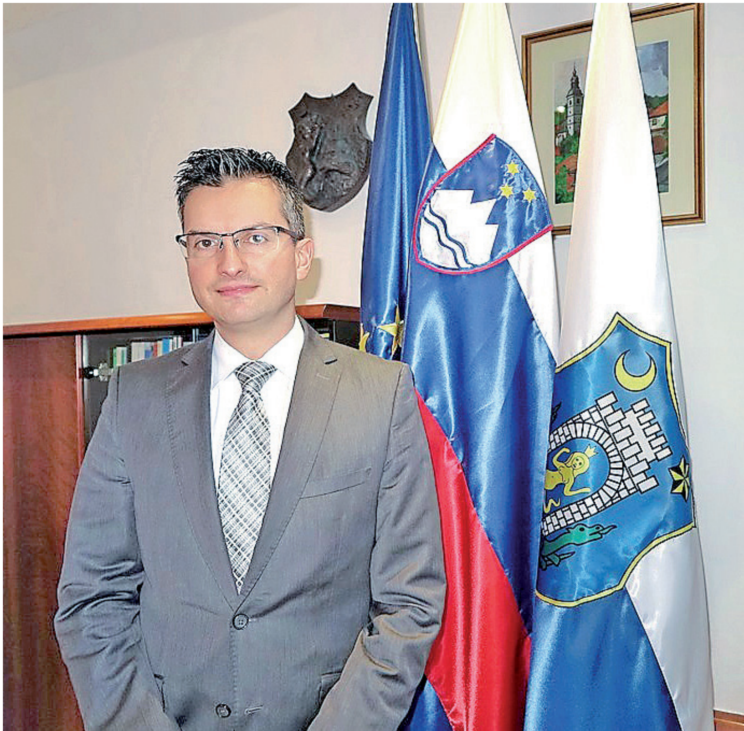
Župan Marjan Šarc