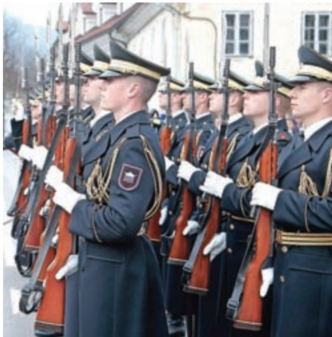
Enota za protokol Slovenske vojske

Občinski svet Občine Kamnik podeljuje Enoti za protokol Slovenske vojske srebrno priznanje Občine Kamnik za dolgoletno nadvse uspešno sodelovanje in pomoč pri izvajanju slovesnosti v spomin na dogodke iz naše zgodovine, še posebej pa za sodelovanje pri ohranjanju spomina na našega rojaka, generala Rudolfa Maistra.