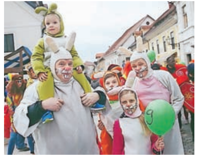
Na Kamniškem karnevalu je bilo letos še posebno veliko našemljenih družin pa tudi nekaj zanimivih skupinskih mask. / BESEDILO: JASNA PALADIN