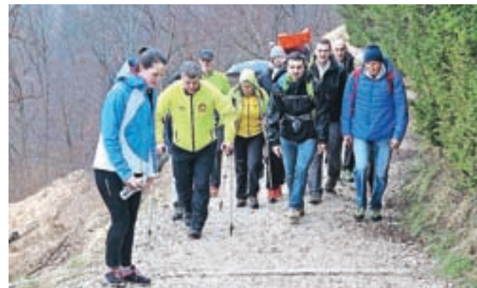
Predsedniku so se na pohodu pridružili tudi nekateri kamniški politiki.

Dobrodelnega marca še ni konec. V petek, 17. marca, sledi turnir v bowlingu z naslovom Si upaš biti dobrodelel, ki je namenjen vsem organizacijam, društvom in podjetjem. Zadnji konec tedna v marcu pa sledita še dva dogodka. V soboto, 25. mar-