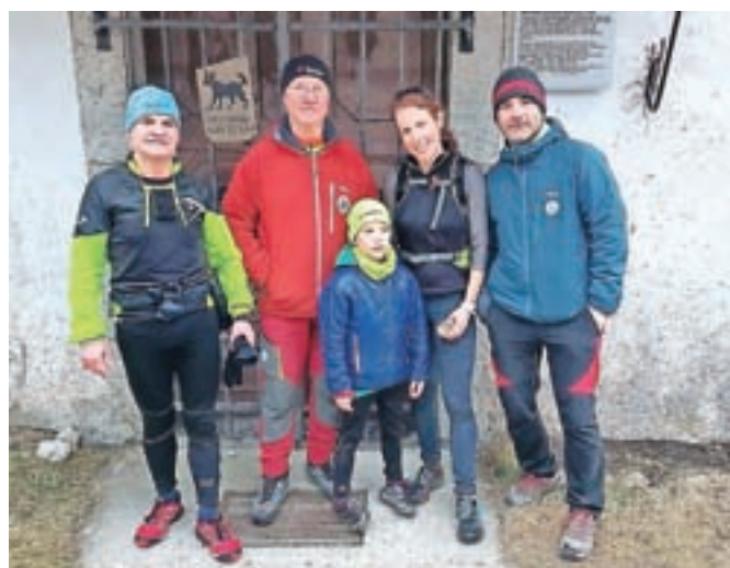
Organizatorji smo bili na ligi veseli udeležencev vseh starosti.