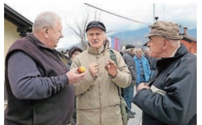
»Pozna kdo to staro sorto?« je vprašanje, ki si ga sadjarji v Tunjicah pogosto zastavijo.