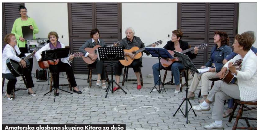
Amaterska glasbena skupina Kitara za dušo