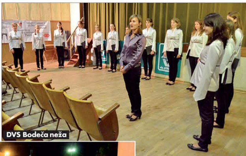
DVS Bodeča neža