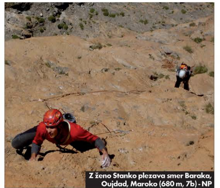
Z ženo Stanko plezava smer Baraka, Oujdad, Maroko (680 m, 7b) - NP

Kako gledaš na zgodovinske ferate v Julijcih, kako pa na nove ekstremne ferate po avstrijskem modelu, pravi fitness ob jeklenici?