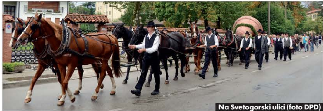
Na Svetogorski ulici