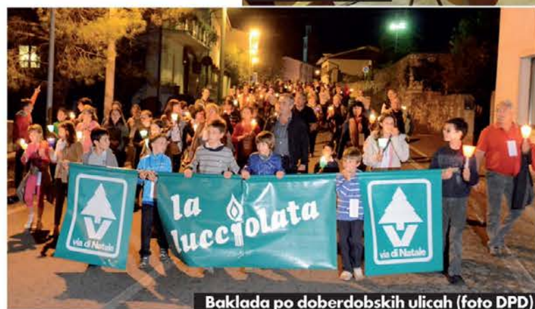
Baklada po doberdobskih ulicah