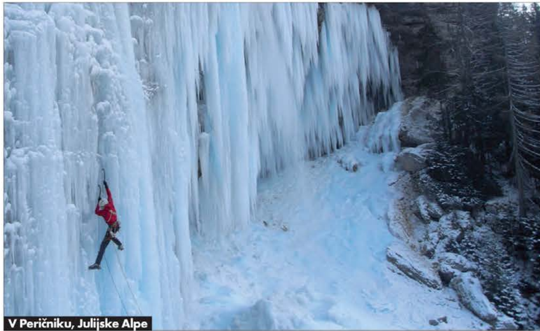
V Peričniku, Julijske Alpe

Kje si nazadnje plezal in osvajal? Vipavski prijatelj mi