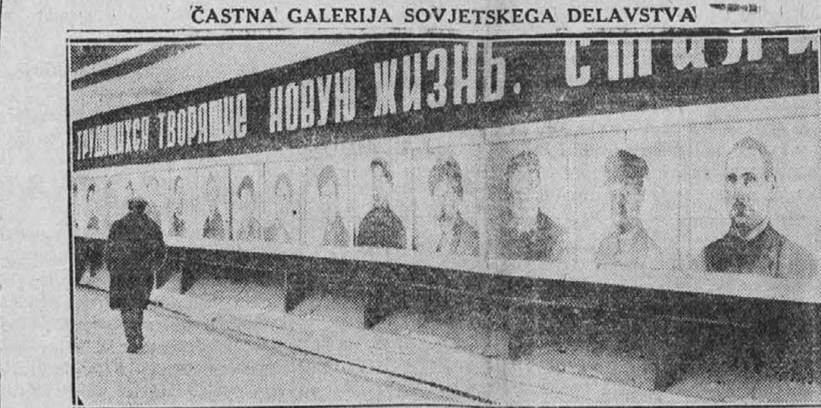
Slika kaže del notranjčine nekega poslopnja v Moskvi, katero je prirejeno v namen, da se v njem izkaže čast tistim delavcem, ki so se posebno odlikovali pri delu za petletko. Na razgled so postavljene slike vseh takih izrednih delavcev.

Washington, D.C. — Tekom sedanjega zasedanja kongresa se bo obširno razmotrivala oborožitev Amerike v zraku. Kakor se napoveduje, se bo prihodnja vojna, kadar bo pač izbruhnila, odigravala v prvi vrsti v zraku, in pehota, kakor tudi mornarica, boste igrali le podrejeno vlogo. Kakor se iz dosedanjih uspehov razvidi, ne bo vzelo več dolgo, ko se bo preko oceana vršila redna potniška prometna služba, in to da tudi misliti, da v slučaju vojne pridejo kaj lahko oddelki sovražnih aeroplanov preko morja in bombardirajo ameriška vojaška taborišča kakor tudi mesta. To daje povod, da bo kongres posvetil posebno pozornost zračni armadi. Eden poslanec namerava v prvi vrsti